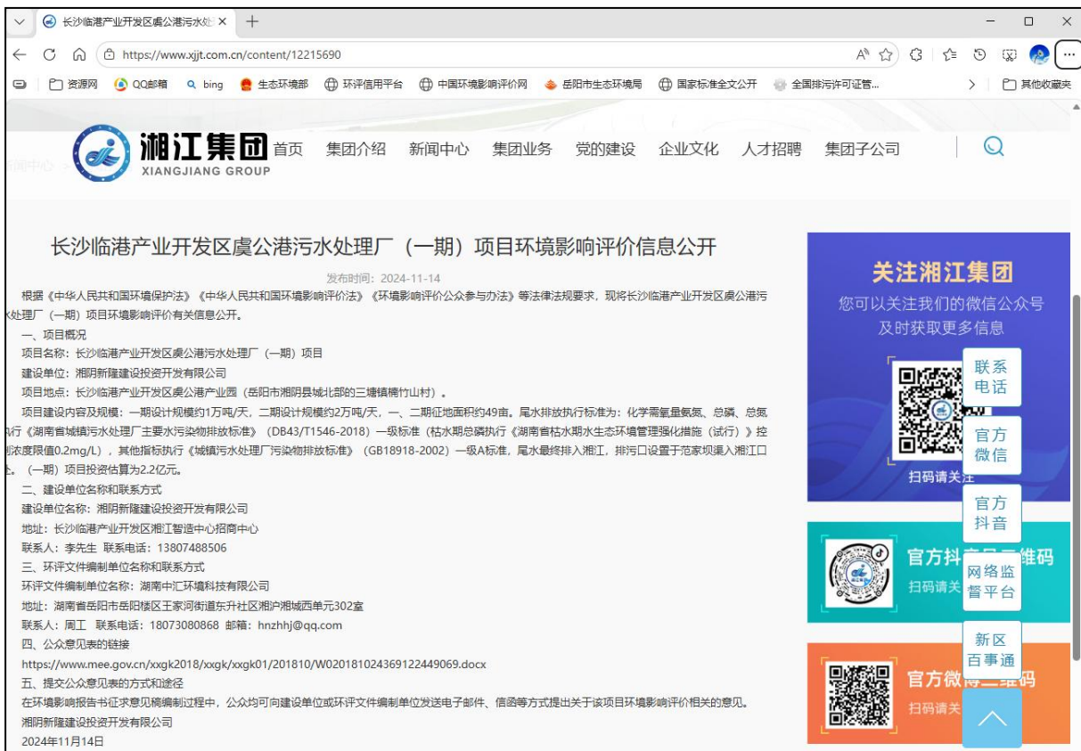
图 2.2-1 首次环境影响评价信息公开网络公示截图

在确定项目环评单位的当天进行了本项目的首次环境影响评价信息公开,公开方式采取网络方式,于2024年11月14日在湘江集团网站公开了首次环境影响评价信息情况。我公司(湘阴新隆建设投资开发有限公司)属于湘江集团控股公司,项目环评第一公示链接为 https://www.xjtt.com.cn/content/12215690 ,公示截图如下: