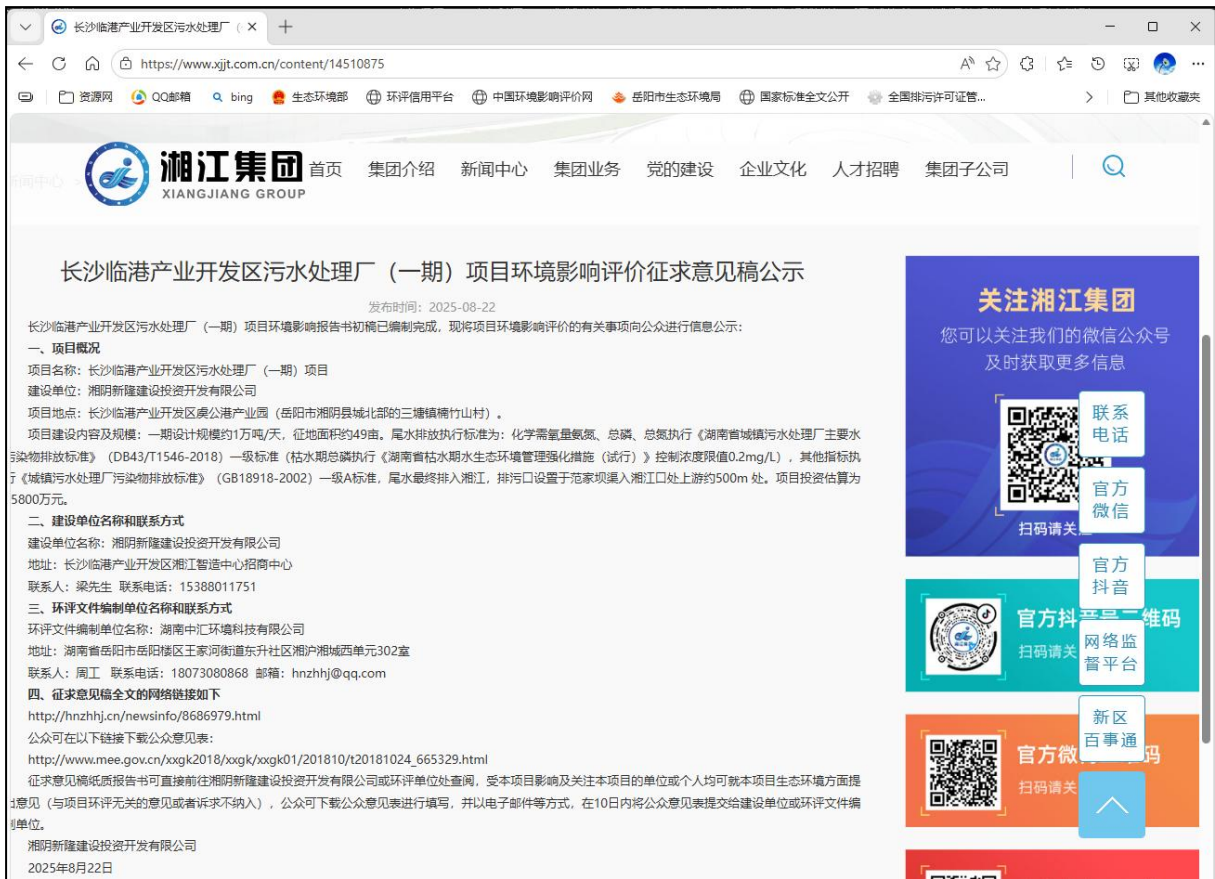
图 2.2-1 征求意见稿公示期间网络公示截图