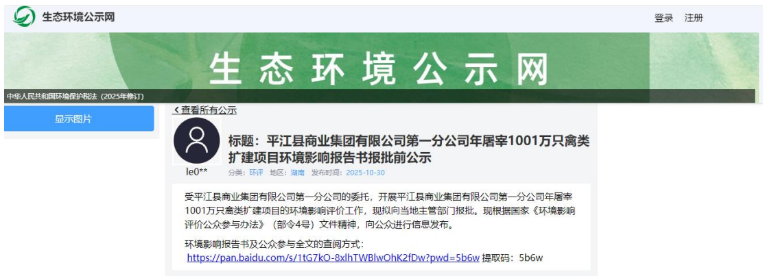
图 6.2-1 报批前公示截图

https://gongshi.qsyhbgj.com/h5public-detail?id=482783 ，公示截图见图 6.2-1。