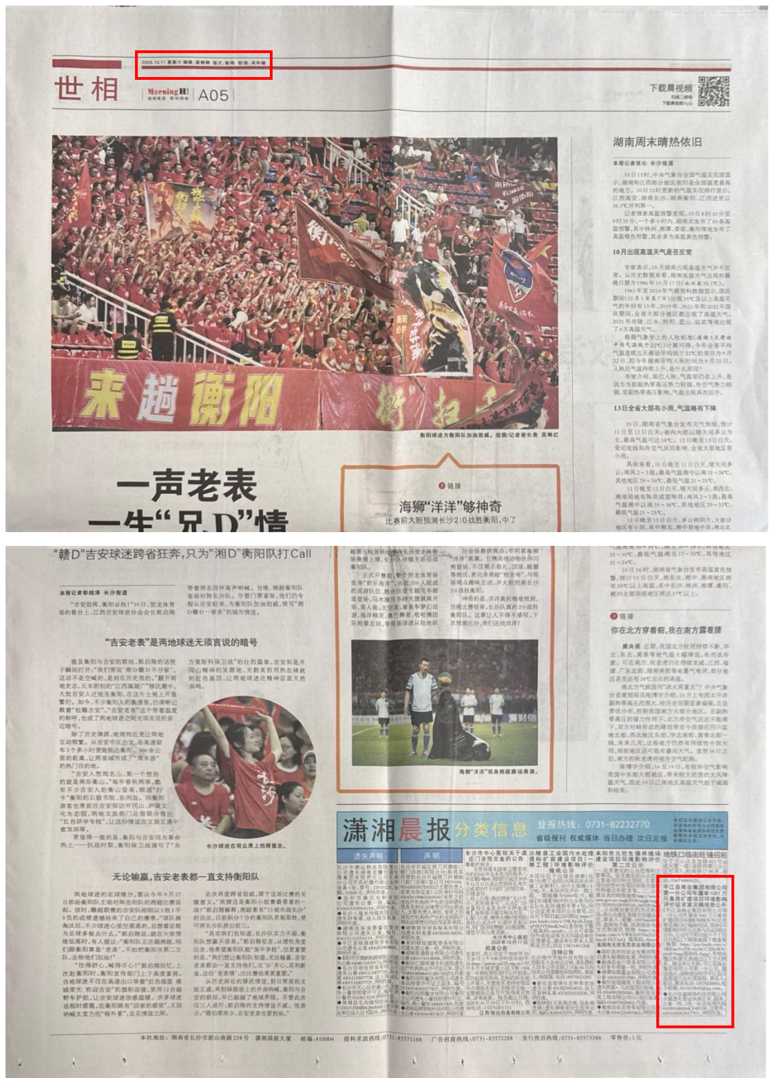
图 3.2-3 2025 年 10 月 11 日报纸公示截图