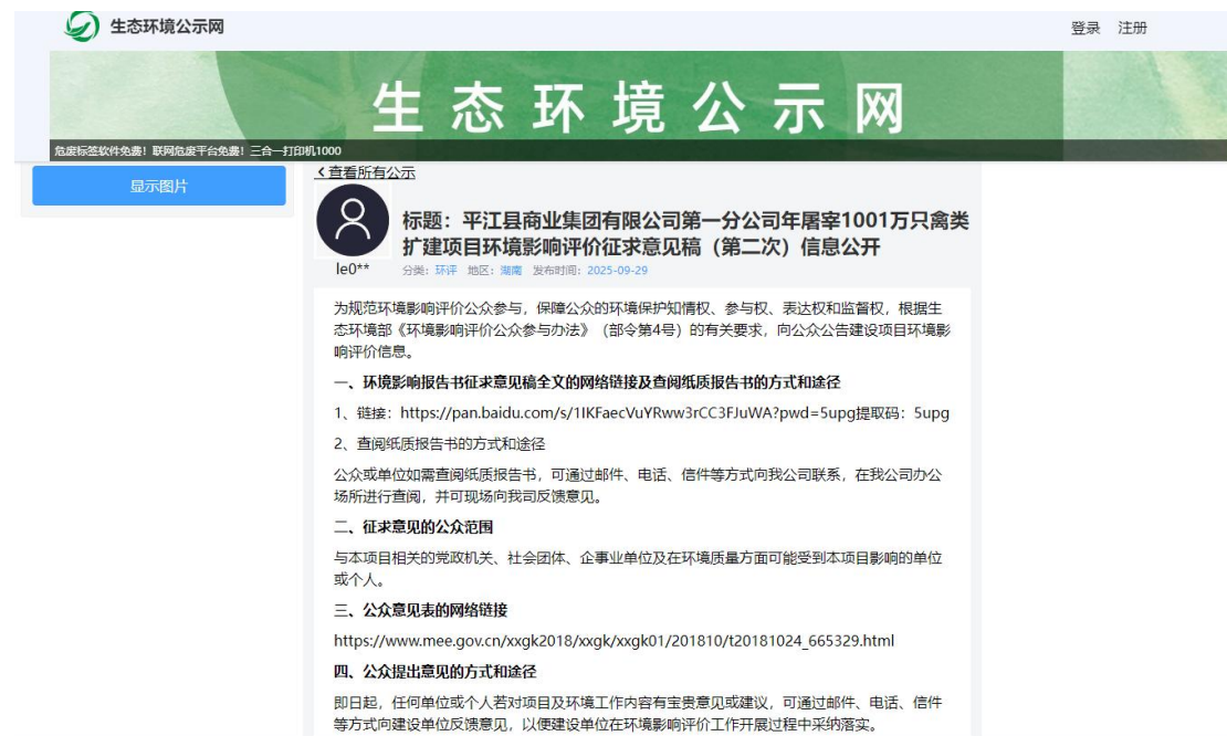
图 3.2-1 2025 年 9 月 29 日征求意见稿网上公示截图

https://gongshi.qsyhbgj.com/h5public-detail?id=478314 ，公示截图见图 3.2-1。