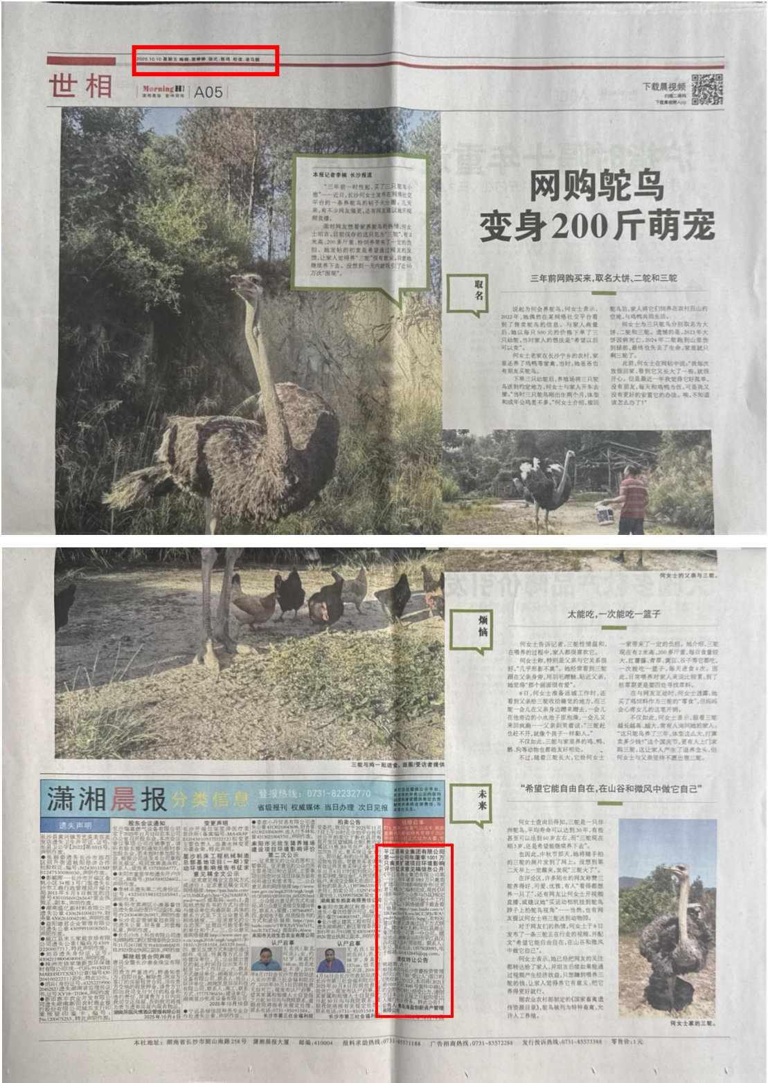
图 3.2-2 2025 年 10 月 10 日报纸公示截图

符合《环境影响评价公众参与办法》（生态环境部令第4号）的要求。报纸截图见图 3.2-2、图 3.2-3。