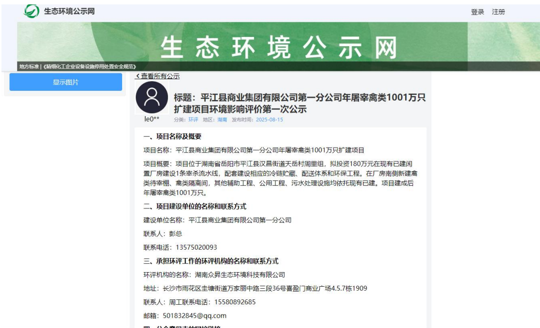
图 2.2-1 2025 年 8 月 15 日网上公示截图

我公司于 2025 年 8 月 15 日在网站发布了《平江县商业集团有限公司第一分公司年屠宰 1001 万只禽类扩建项目环境影响评价第一次公示》，公示时间为 10 个工作日，公示网址为： https://gongshi.qsyhbgi.com/h5public-detail?id=470403 ，公示截图见图 2.2-1。