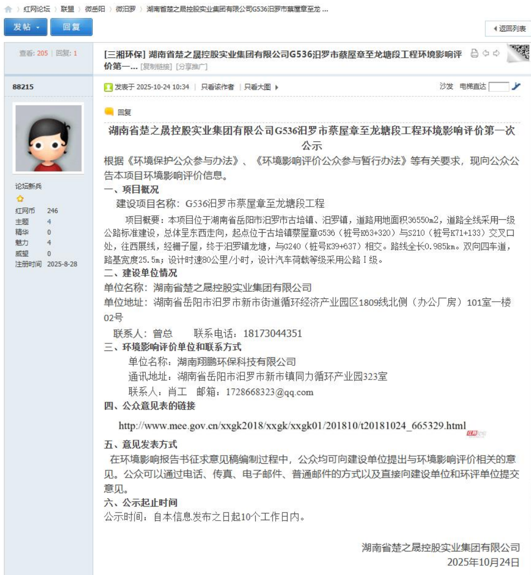
图 1 首次环境影响评价网站公示截图照片

网络公示时间：2025 年 10 月 24 日至 11 月 7 日。 网址： https://bbs.rednet.cn/thread-49196249-1-1.html 截图见下图 1。