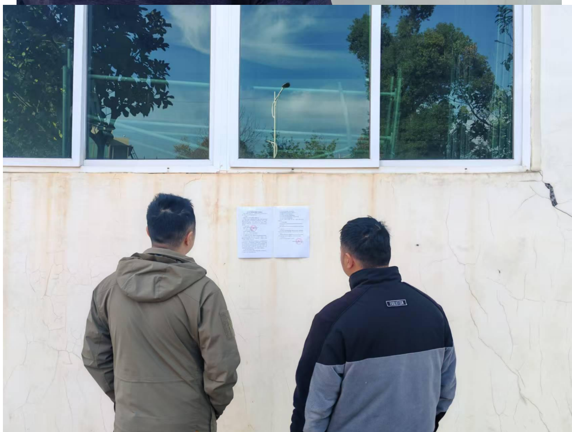
图 4 项目现场公示照片