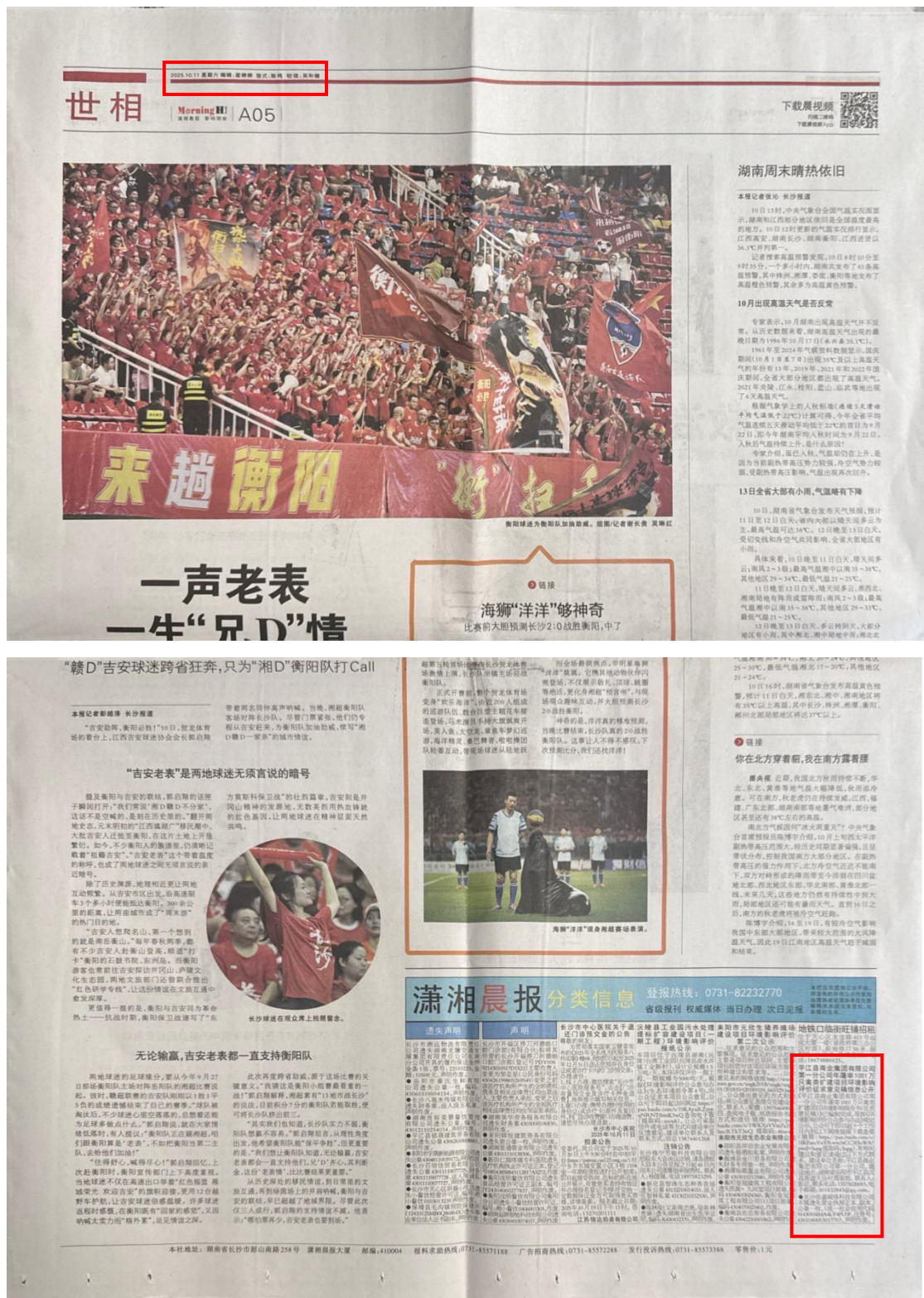
图 3.2-3 2025 年 10 月 11 日报纸公示截图