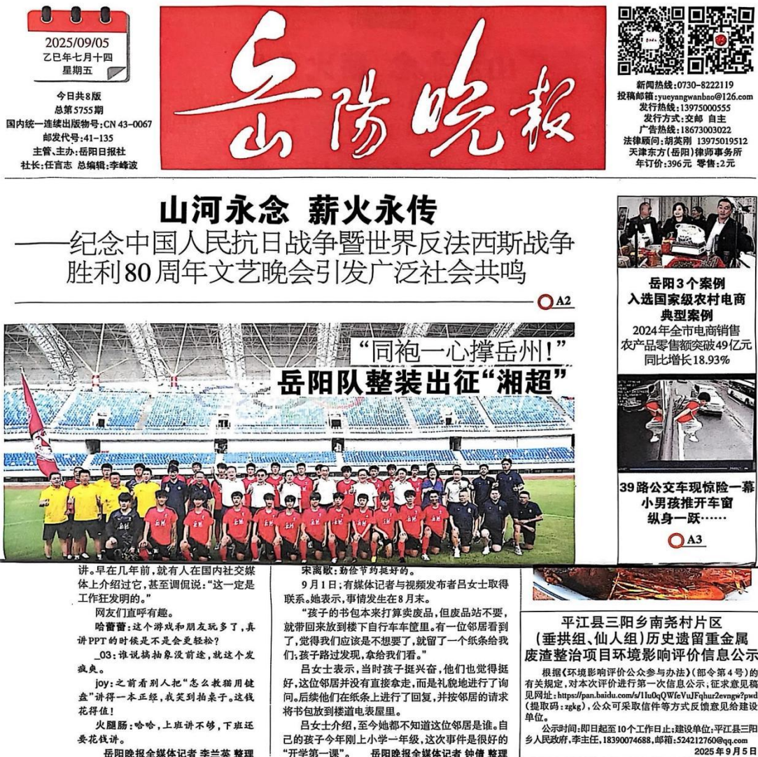
图 3.2-2 第一次报纸公示截图