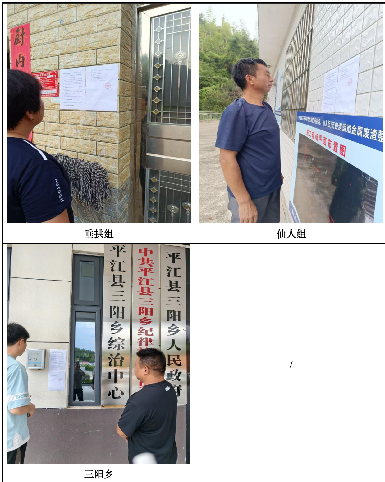
图 3.2-4 第二次环境影响评价信息现场公示照片

我单位在项目环境影响报告书征求意见稿形成后，采取了网络信息公示、报纸公示以及现场张贴公示 3 种形式向评价范围内公众进行了环境影响信息公示，公示日期均不少于 10 个工作日，并发布了征求意见稿全文查看的网络链接、查阅纸质报告书、公众意见表的网络链接获取方式和途径。