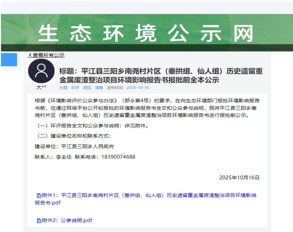
图 5.2-1 报批前公示截图

本次公开选取了生态环境公示网进行公示，符合《环境影响评价公众参与办法》中要求的“网络平台”。《平江县三阳乡南尧村片区（垂拱组、仙人组）历史遗留重金属废渣整治项目环境影响报告书》报批前全本公开时间为 2025 年 10 月 16 日，网络公示链接为： https://gongshi.qsyhbgj.com/h5public-detail?id=480345 ，网络公示截图如下。