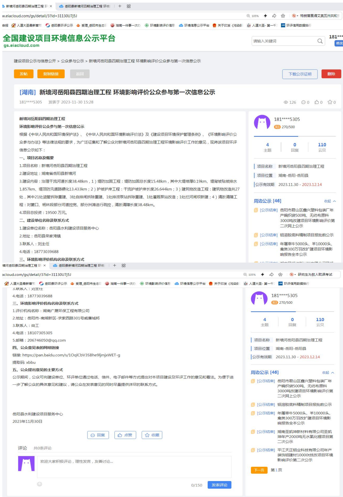
图 1 第一次环境影响评价网站公示截图照片