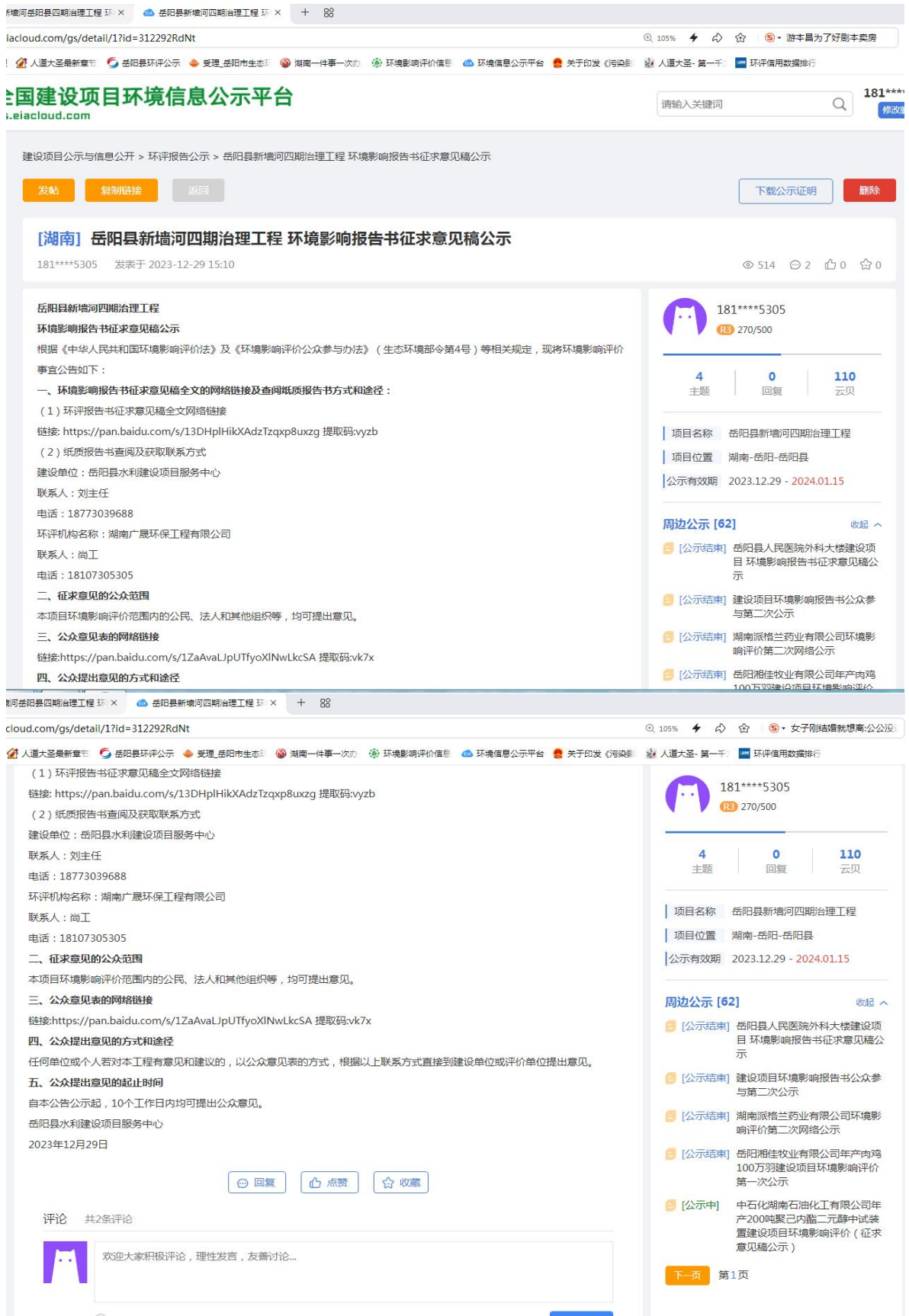
图 2 征求意见稿网上公示截图