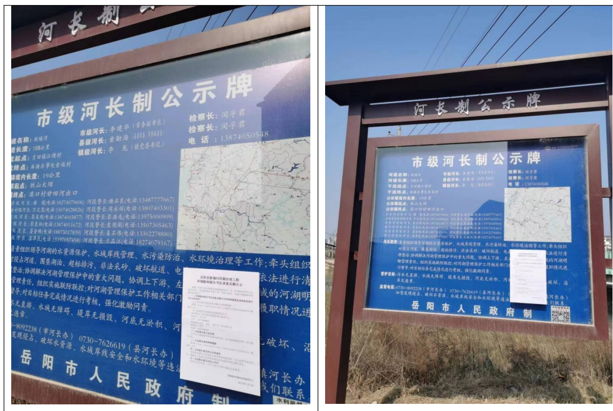
图 4 项目现场公示照片