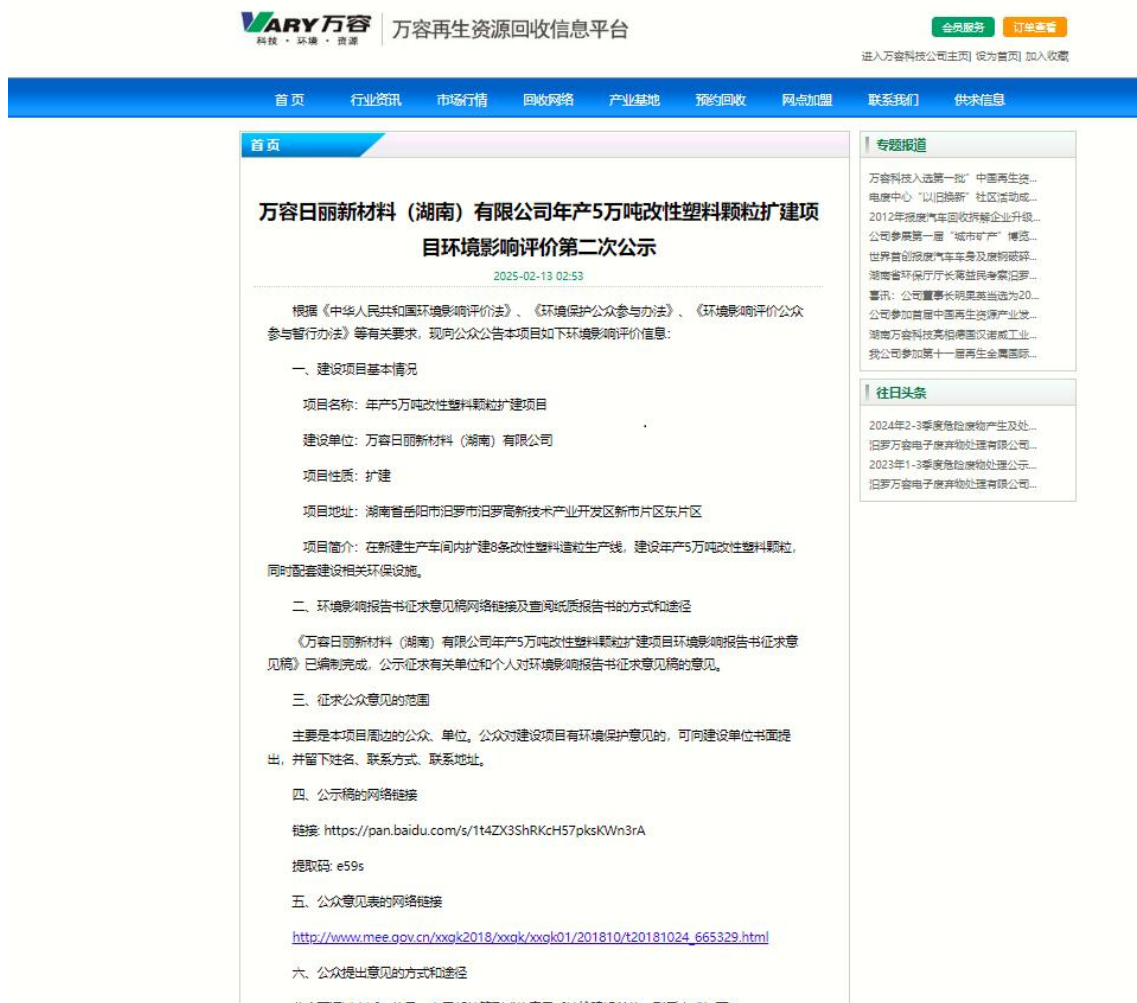
图 2 第二次网络公示