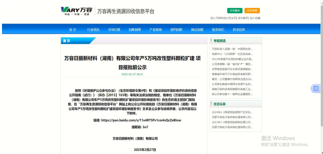
图 6 报批前公示

建设单位在环境影响报告书报批前，在“万容再生资源回收信息平台”上进行了报批前公示，公开了项目环评报告书及公参说明手册。