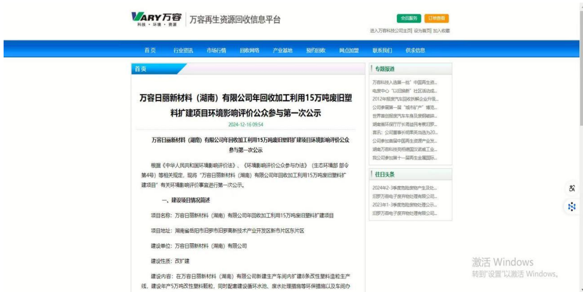
图 1 第一次网络公示图片