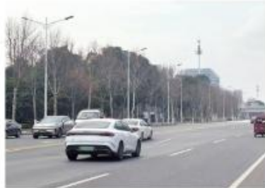
塌陷的路面