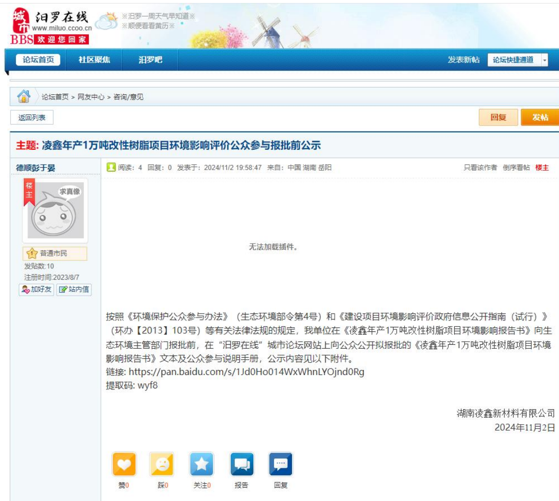
图 6 报批前公示

建设单位在环境影响报告书报批前，在“汨罗在线”上进行了报批前公示，公开了项目环评报告书及公参说明手册。