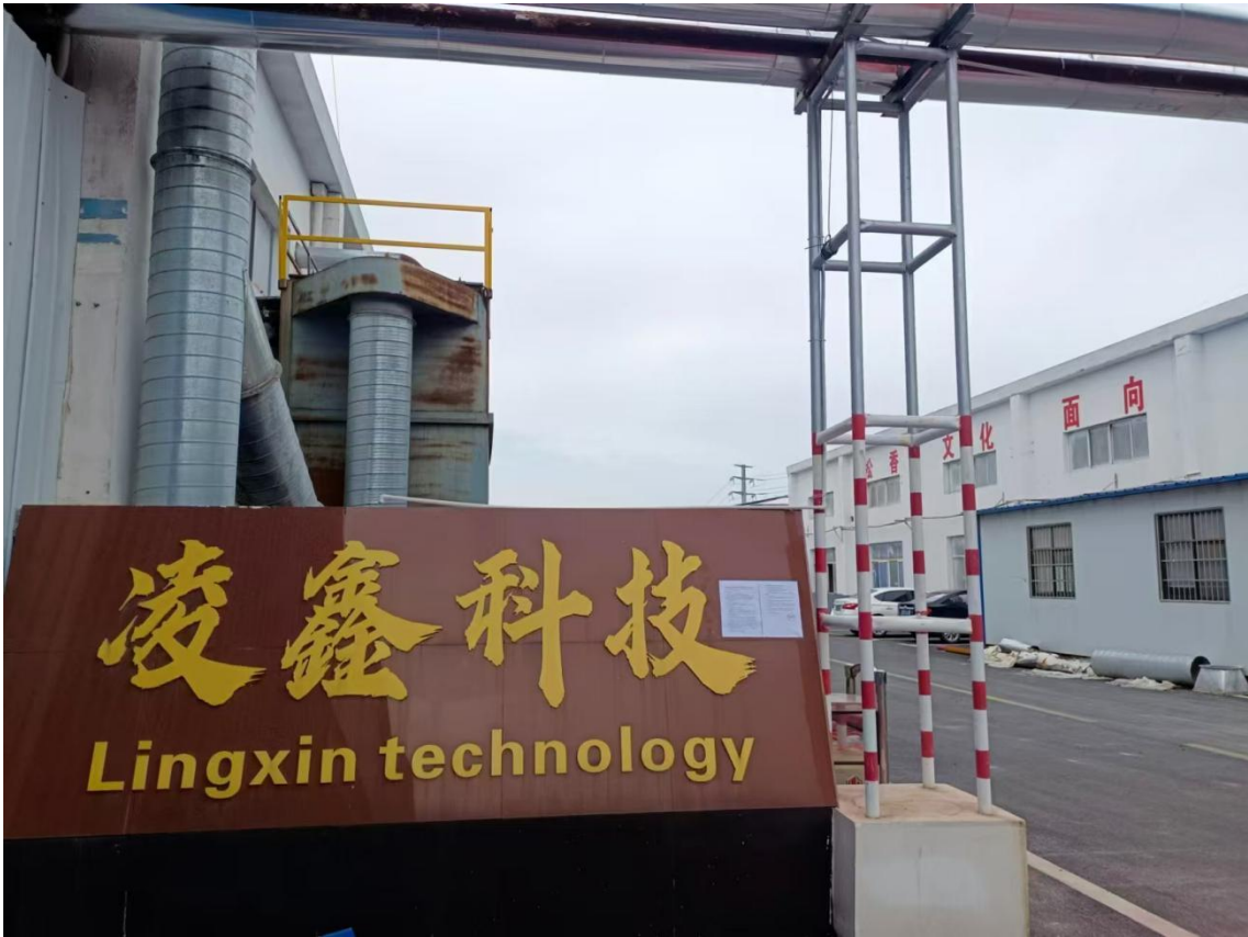
图3 二次现场张贴公示