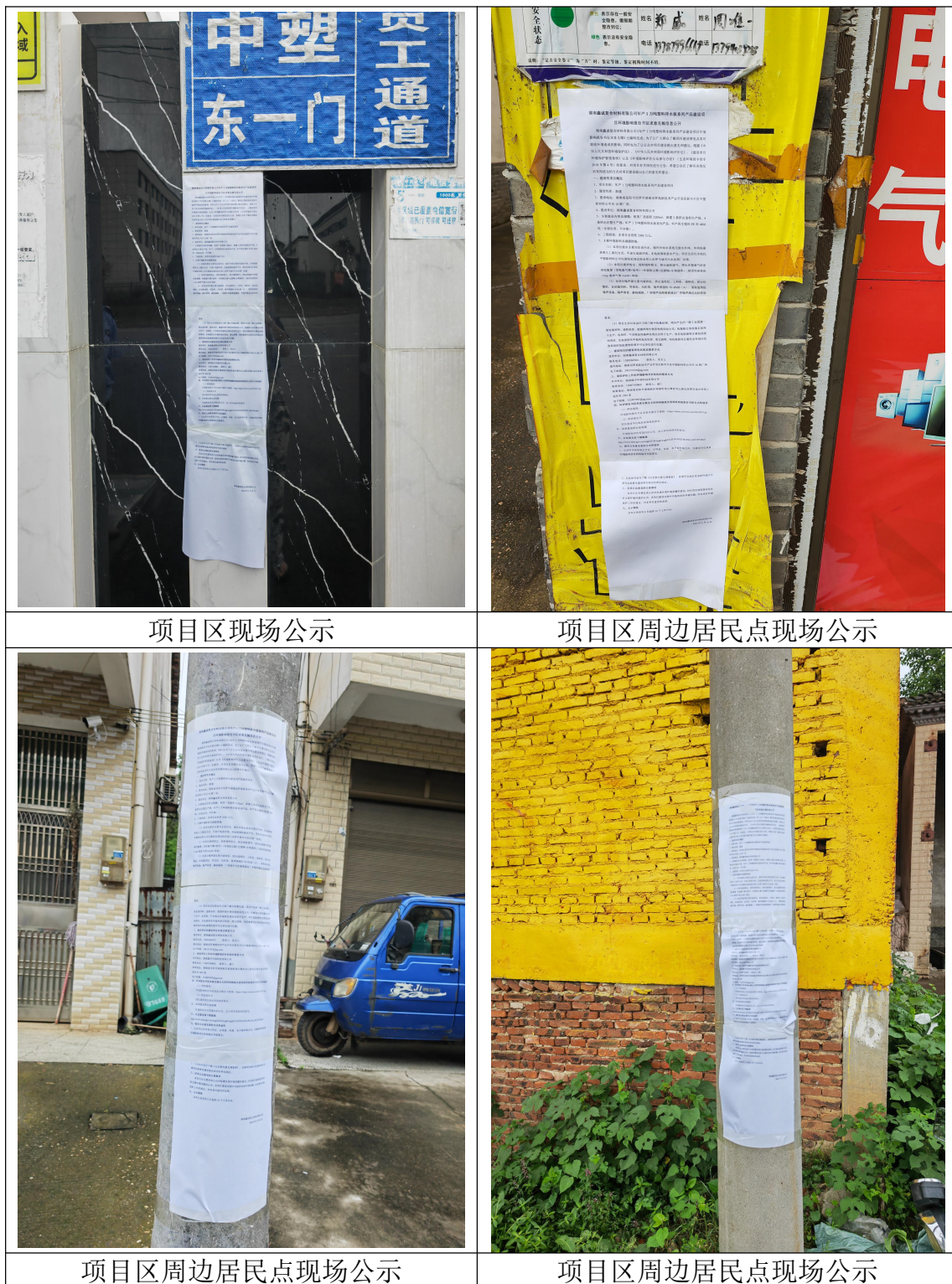
图 1.2-5 现场张贴公示截图

征求意见稿形成后，同时在项目所在区域进行了征求意见稿现场公示，现场公示时间为 10 个工作日，公示起止时间为 2024 年 5 月 23 日~2024 年 6 月 3 日。