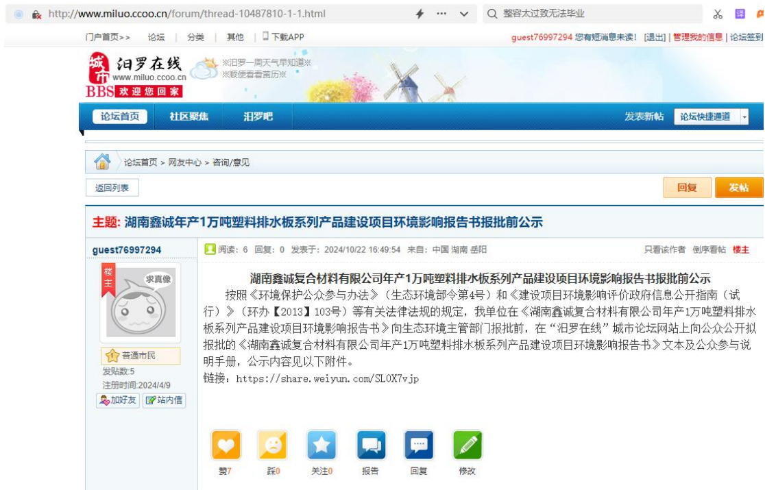
图 1.2-6 报批前公示截图