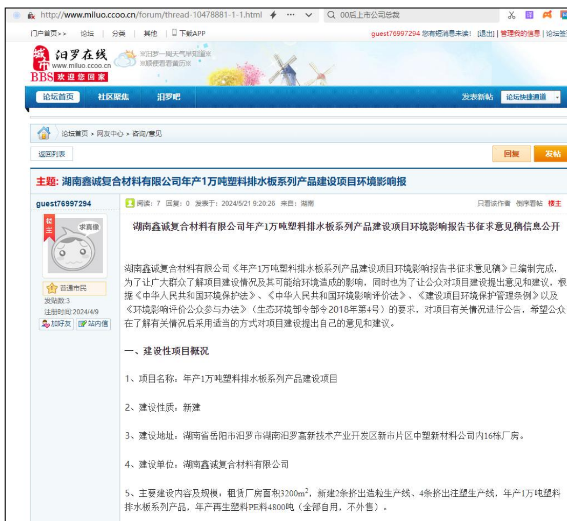
图 1.2-1 征求意见稿汨罗在线网络公示截图

http://www.miluo.ccoo.cn/forum/thread-10478881-1-1.html 。