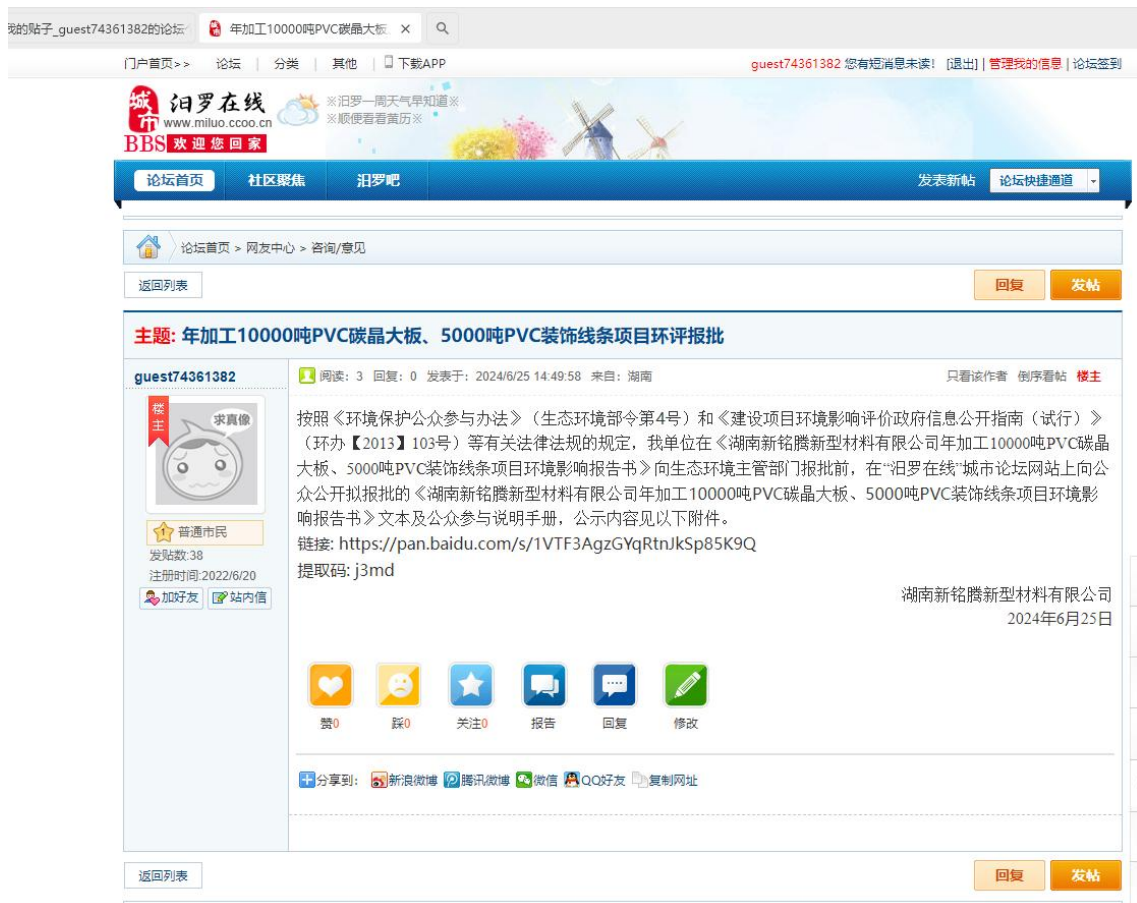
图 6 报批前公示