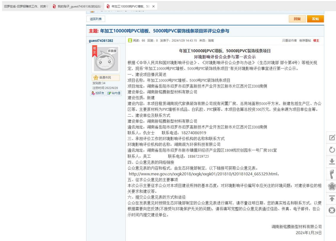
图 1 第一次网络公示图片