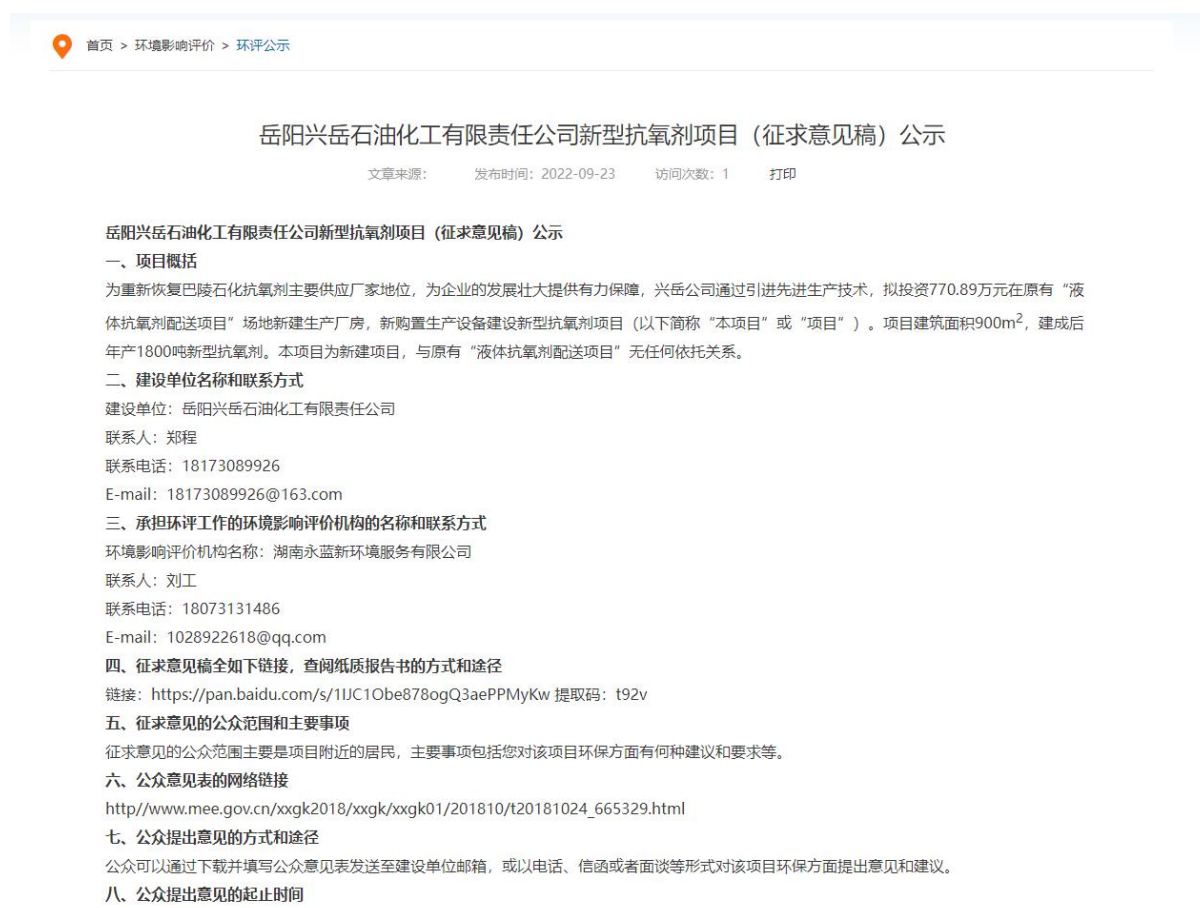
图2 征求意见稿网络公示截图（湖南环保管家公共服务平台网站）

网络公示链接地址：湖南环保管家公共服务平台网站（公示链接地址： https://www.hnhbgj.com/eia/gongshi/6333.html ）。截图详见图2。