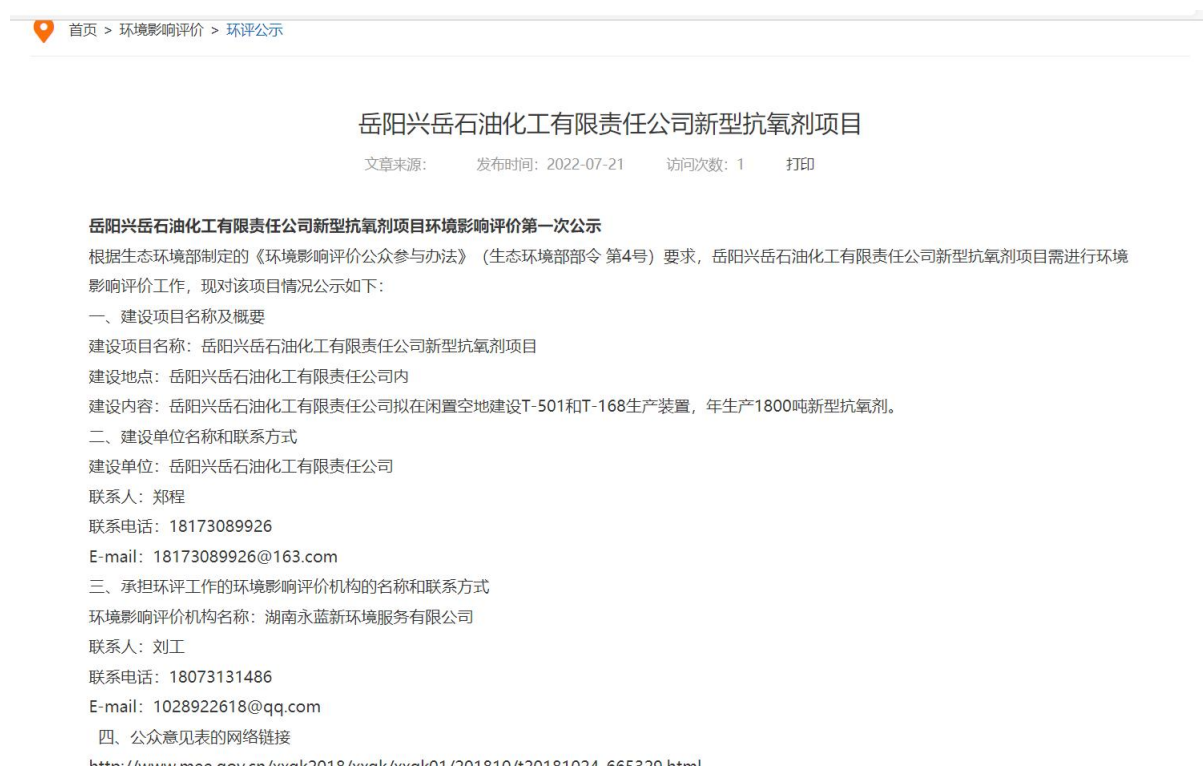
图 1 首次环境影响评价信息公开网络公示截图（湖南环保管家公共服务平台网站）

本项目在湖南环保管家公共服务平台网站进行首次环境影响评价信息公开期间未收到公众提出意见。