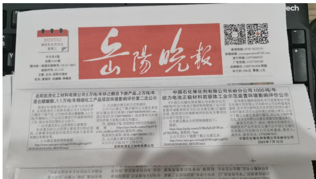
图3 2023年7月12日岳阳晚报第一次公示照片

载体选取的符合性分析：本项目位于湖南省岳阳市，其项目公示方式采用建设项目所在地且公众易于接触的报纸公开。在征求意见的10个工作日内刊登征求意见稿公示信息2次，载体的选取符合《环境影响评价公众参与办法》的要求。