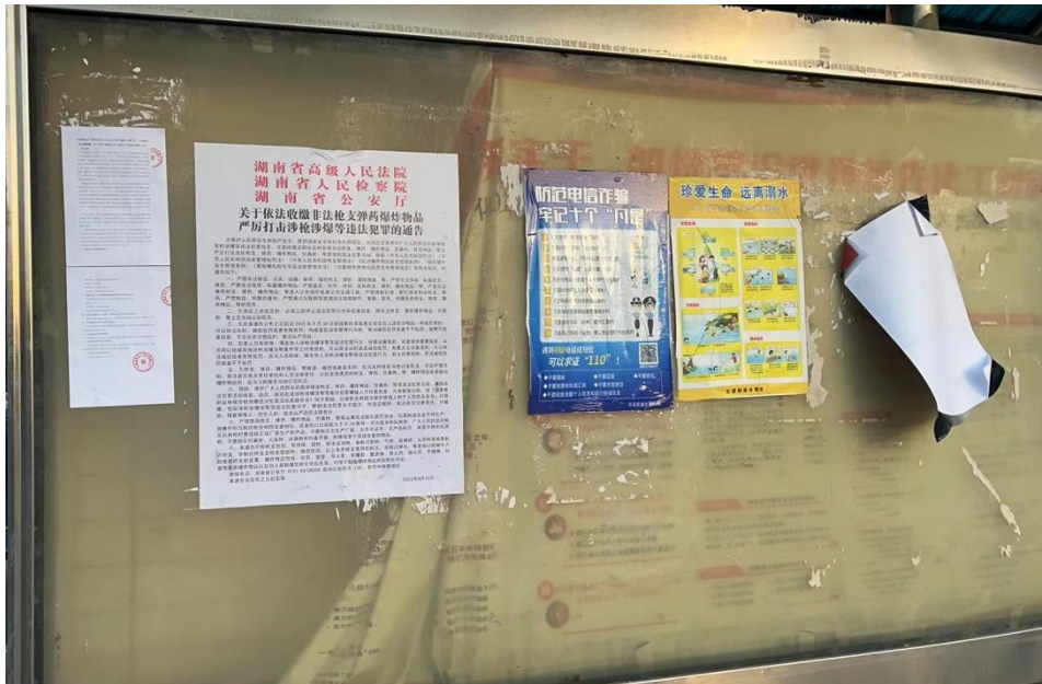
图 5 现场张贴公示照片

张贴区域选取的符合性分析：本项目张贴公示选取项目所在地社区委员会公开栏以及项目所在地，公众获取信息方便，并 2023 年 7 月 5 日起至 2023 年 7 月 18 日连续 10 个工作日，符合《环境影响评价公众参与办法》要求：通过在建设项目所在地公众易于知悉的场所张贴公告的方式公开，且持续公开期限不得少于 10 个工作日。