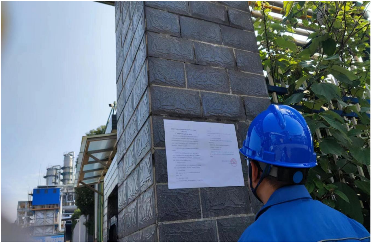
图3 二次现场张贴公示