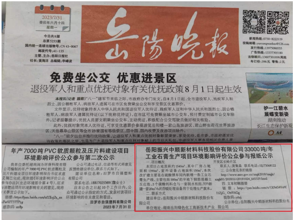
图3 项目报纸上公示图片