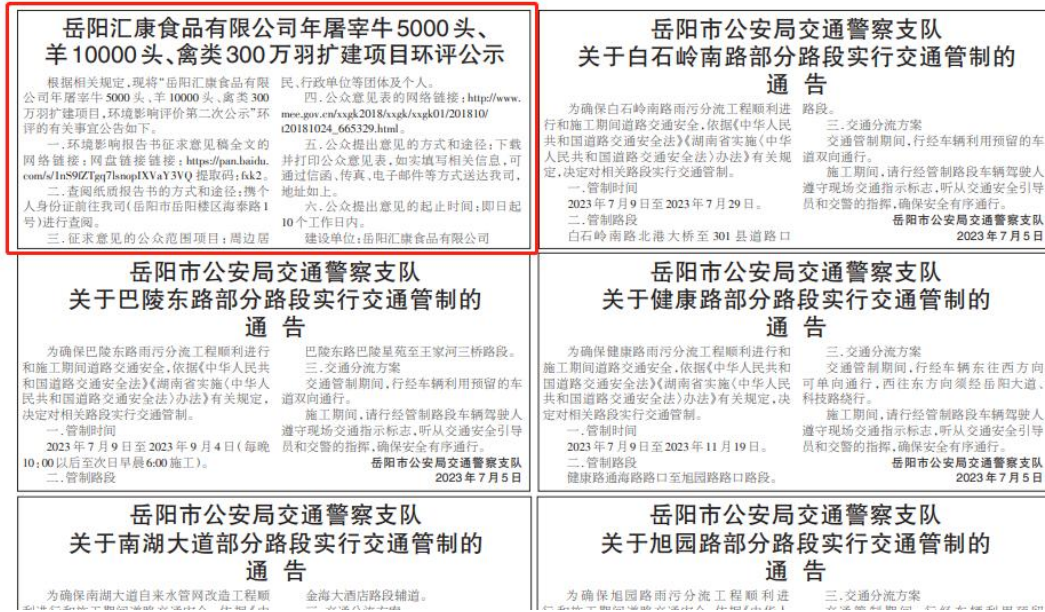
图3 报纸公示照片(2023年7月6日)

蒙脱石散宜空腹服用,避免在 后服用益生菌,一般间隔1至2小 饭前或饭后30分钟之内服用,因 时;服用益生菌1至2小时后,再 为食物会影响蒙脱石散在肠道表 服用抗菌药物。