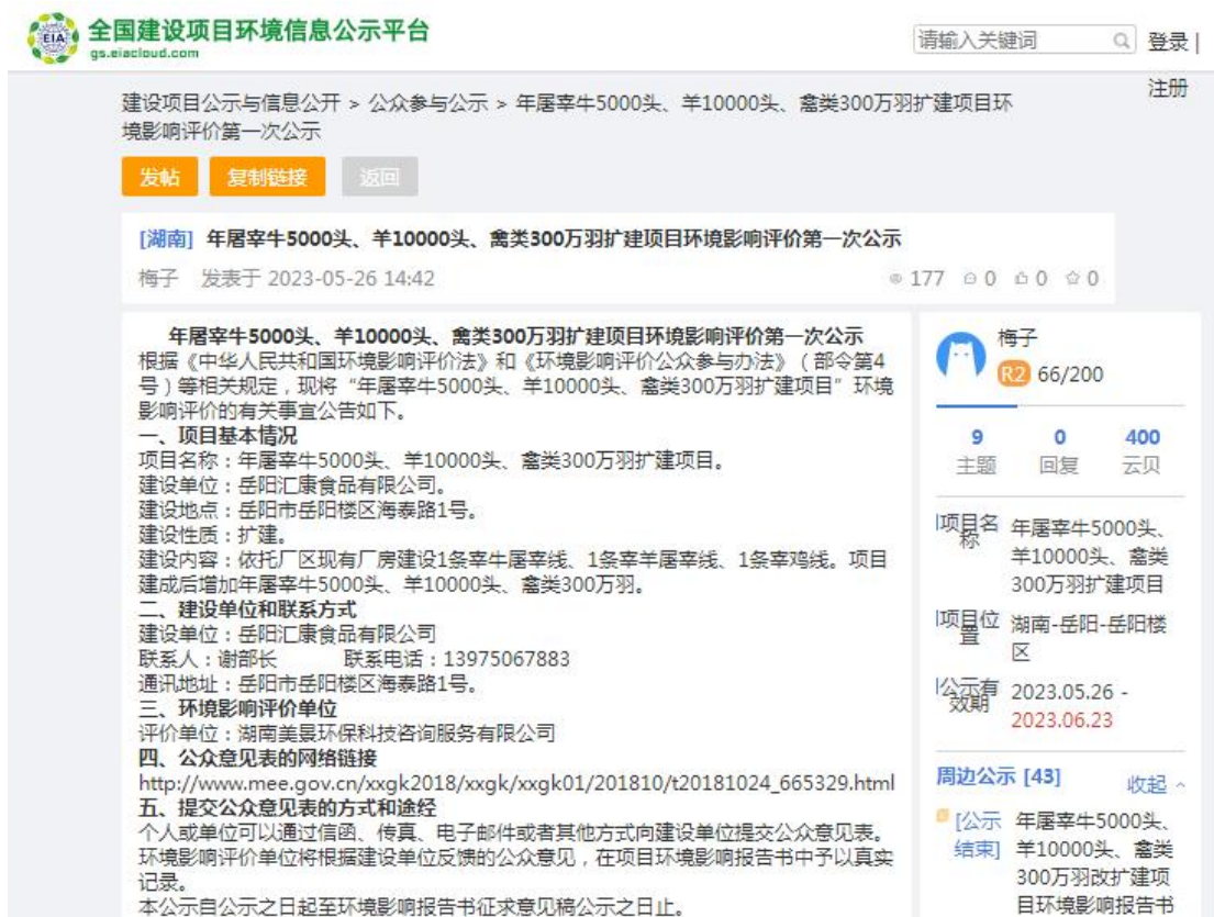
图1 首次环境影响评价信息公开网站截图