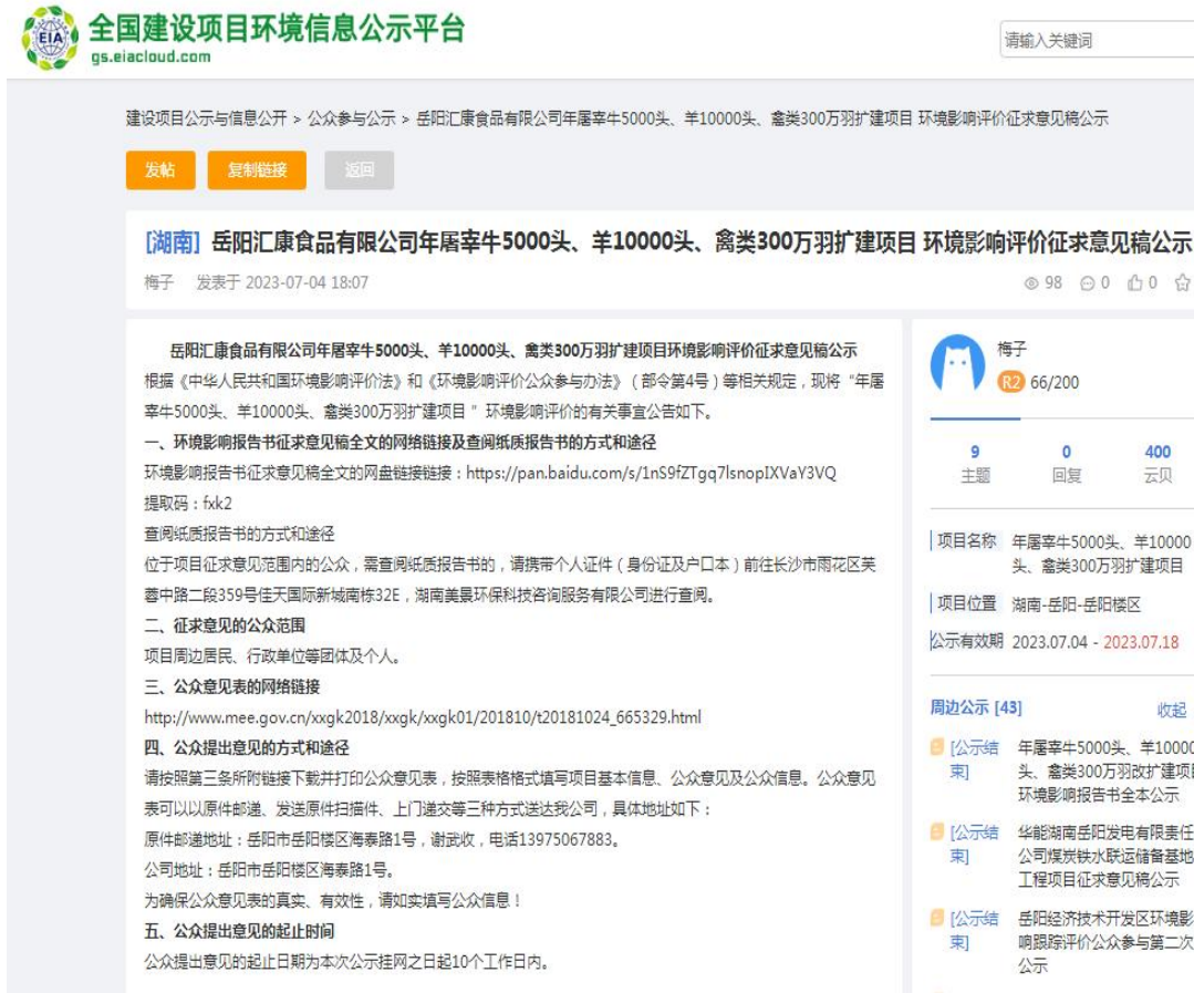
图 2 征求意见稿信息公开网站截图