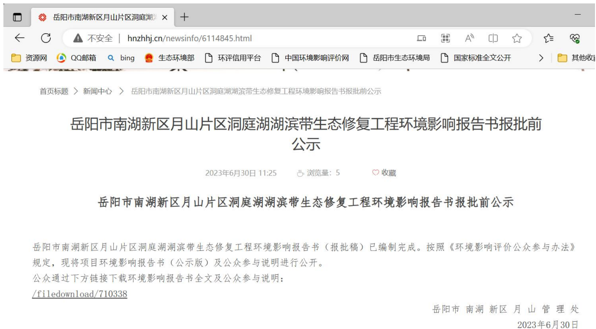
图 6.2-1 报批前网络公示截图

项目报批前公开方式为网络公示，公开时间为 2023 年 6 月 30 日，网址链接为 http://hnzhhj.cn/newsinfo/6114845.html ，报批前公示截图见下图。