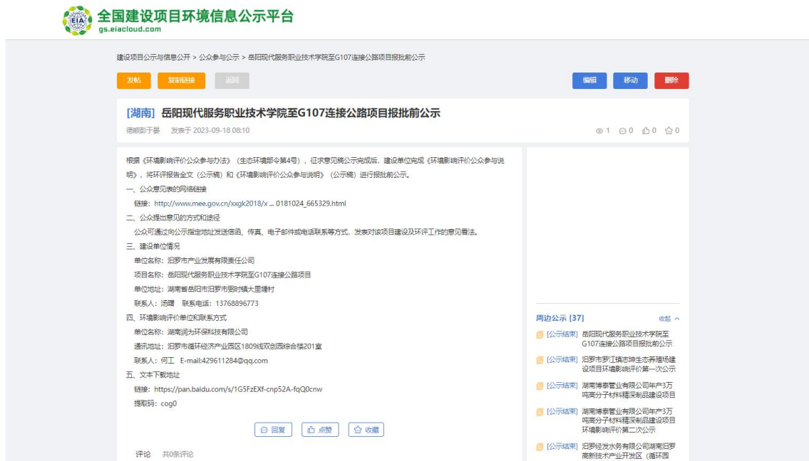
图 6 报批前公示

建设单位在环境影响报告书报批前，在“全国建设项目环境信息公示平台”上对项目进行了报批前公示，公开了项目环评报告书及公参说明手册。