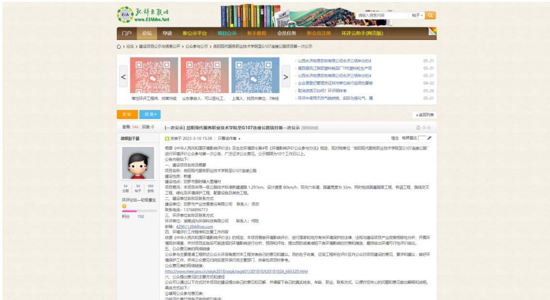
图 1 第一次网络公示图片