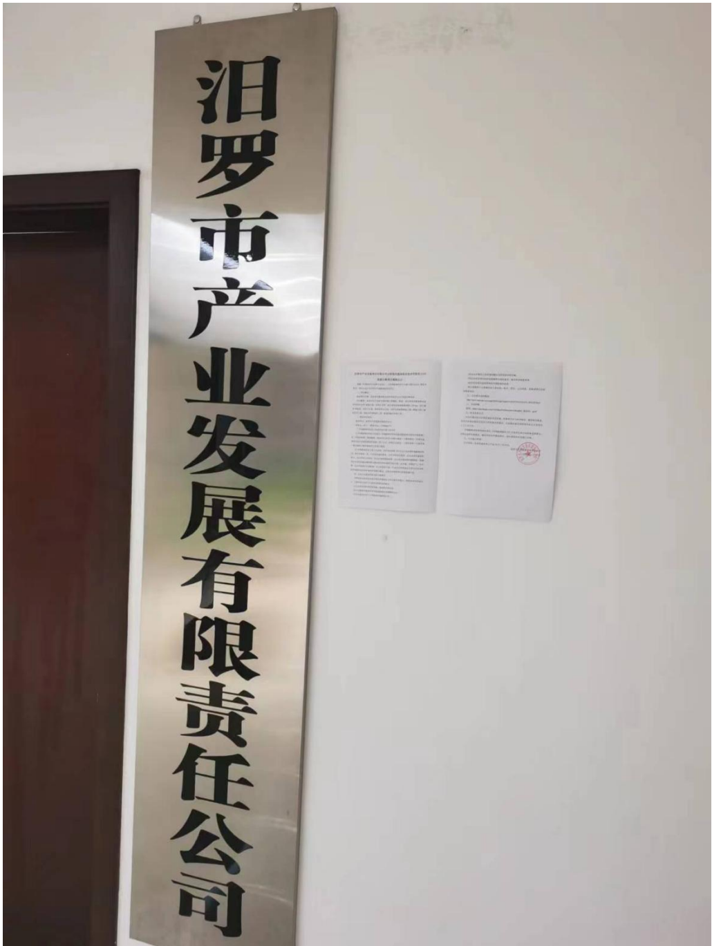
图3 二次现场张贴公示（2）