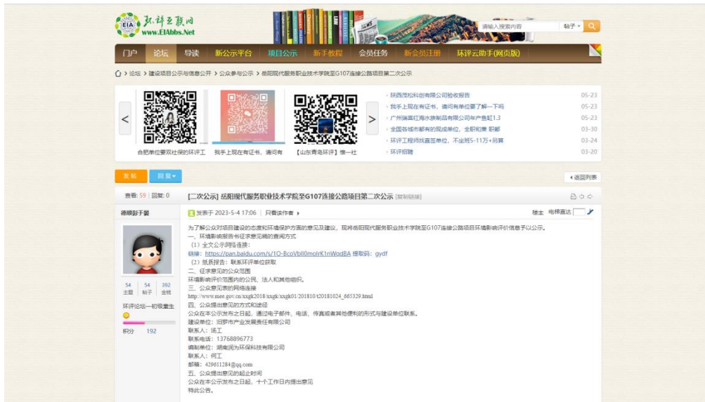
图 2 第二次网络公示