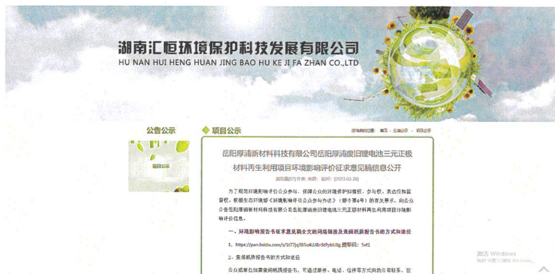
图 3.2-1 征求意见稿网上公示截图

建设单位于2023年3月20日在湖南汇恒环境保护科技发展有限公司网站发布了项目环境影响评价征求意见稿公示，公示时间为10个工作日，公示网址为 http://www.hnhuiheng.com/index.php?g=home&m=notice&a=show&id=388 ，公示截图见图3.2-1。