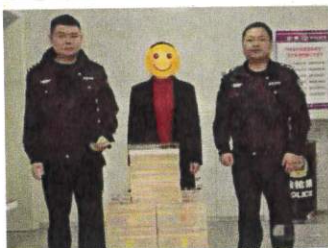
岳东派出所将追回赃物送还给受害群众

3月以来,岳阳市公安局岳东分局大力开展了学雷锋活动,用实际行动践行新时代雷锋精神。