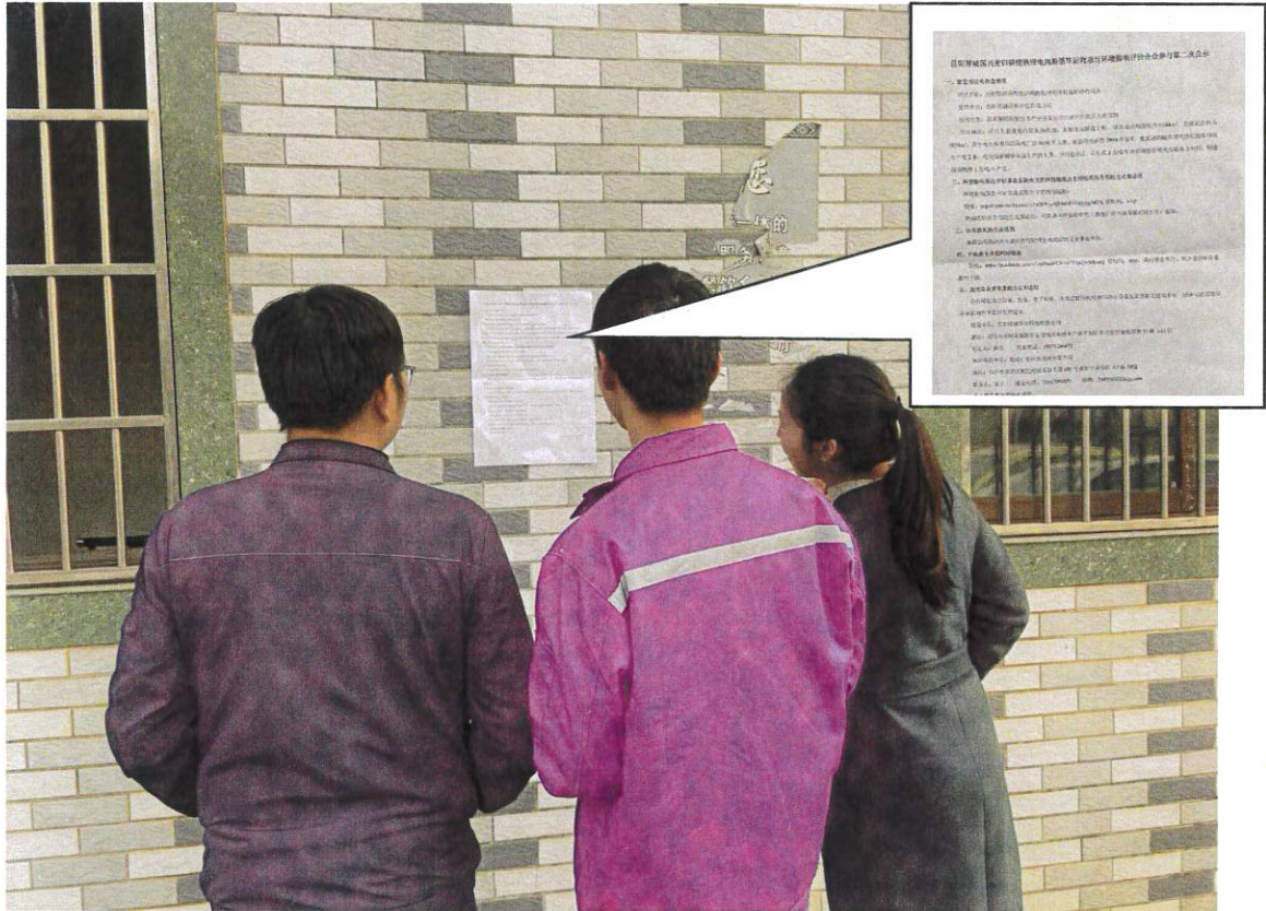
图 3.2-4 现场张贴公示照片

张贴区域选取的符合性分析：本项目征求意见稿公示选取本项目及周边敏感点作为张贴区域，并于 2023 年 3 月 20 日-2023 年 3 月 31 日连续 10 个工作日进行张贴公示，符合《环境影响评价公众参与办法》（生态环境部令第 4 号）要求。