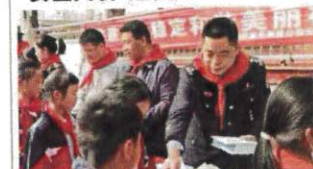
民警向学生进行法治宣传

本报讯(通讯员 李娅 记者 殷佳)普法活动,安全课堂——连日来,岳阳楼公安分局积极组织“法治第一课”活动,多警联动,警地联合,广设宣传品防范、预防电诈、拒绝欺凌等安全知识,让丰富多彩的“安全大餐”走进校园,让“警营开放”为师生们带来最真切的安全感。