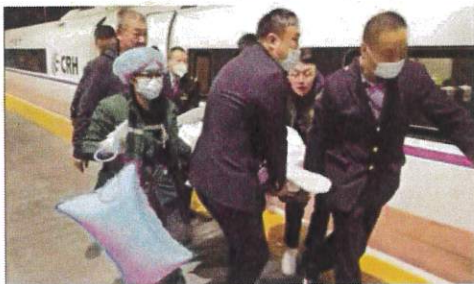
大家将旅客从列车上转运下来,通过绿色通道搬上了救护车。

本报讯(记者 罗凯 通讯员 董小双)“岳阳东站,我是G848次列车长,我车上8号车厢有一名重点旅客,刚刚做完开颅手术,只能平躺,需要在岳阳东站下车,救护车来接,你们要早做准备。”3月28日,高铁岳阳东站客运值班员吴浩接到了来自列车长的信息通报。原来,段先生