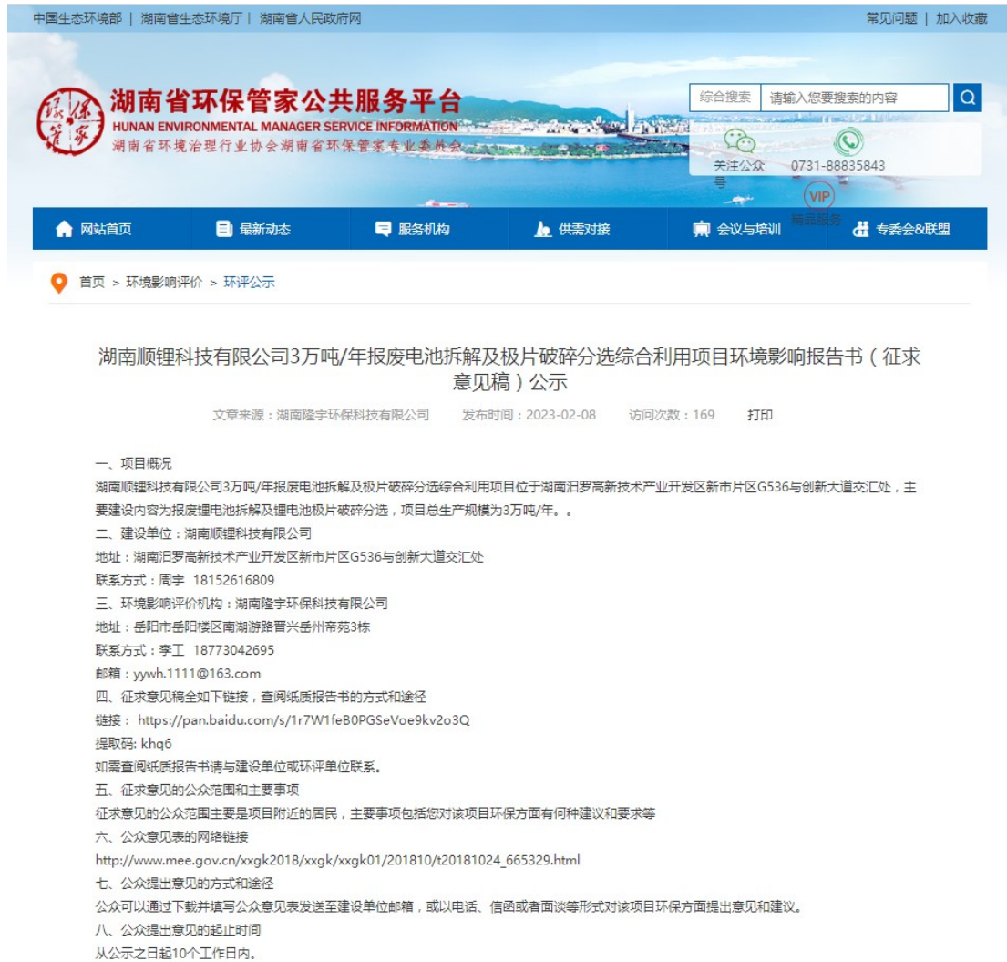
图2 征求意见稿网上公示截图