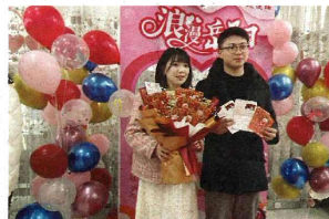
2月14日,岳阳楼区民政局婚姻登记处迎来一波结婚登记小高峰。

“顺利的话,我们今年国庆节前后就会结婚了。”胡女士今年28岁,以前年年过年都被催婚,今年终于不再单着了。胡女士说,经亲戚介绍,她和一个小伙子交往差不多半年了,在此之前,她计划在29岁之前结婚。一切都刚刚好,她遇上了那个对的人。