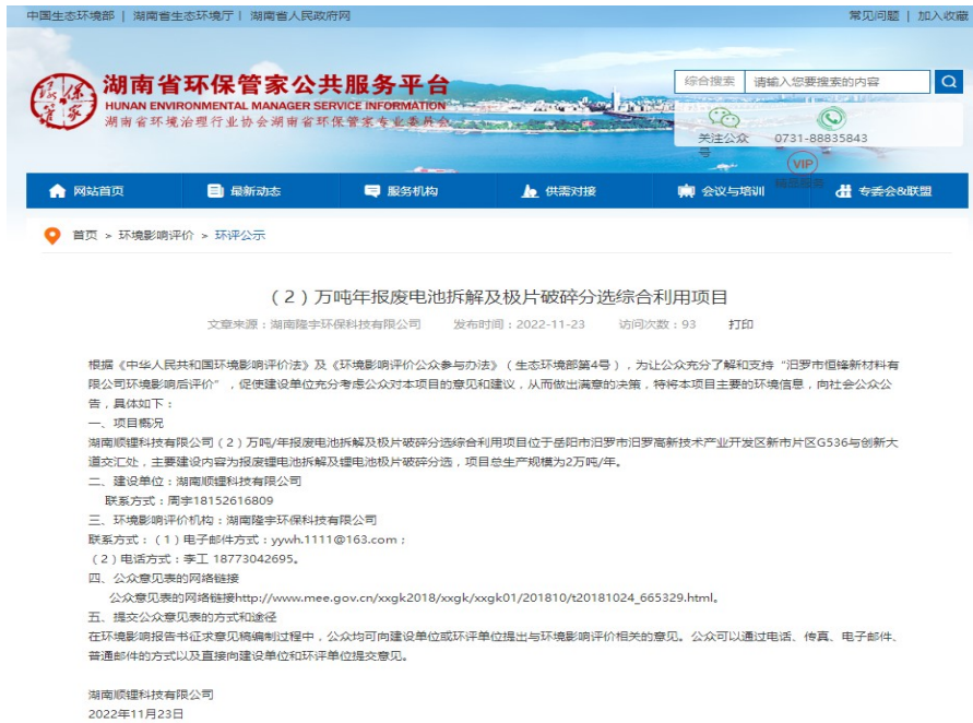
图 1 首次环境影响评价网站公示截图照片