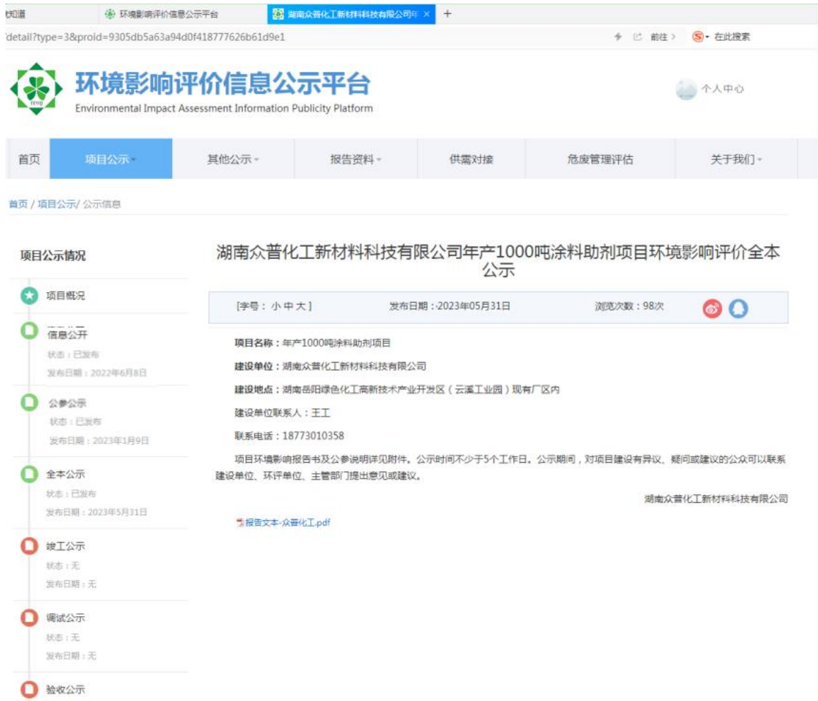
图 5 环境影响报告书报批前公示-网站公示截图