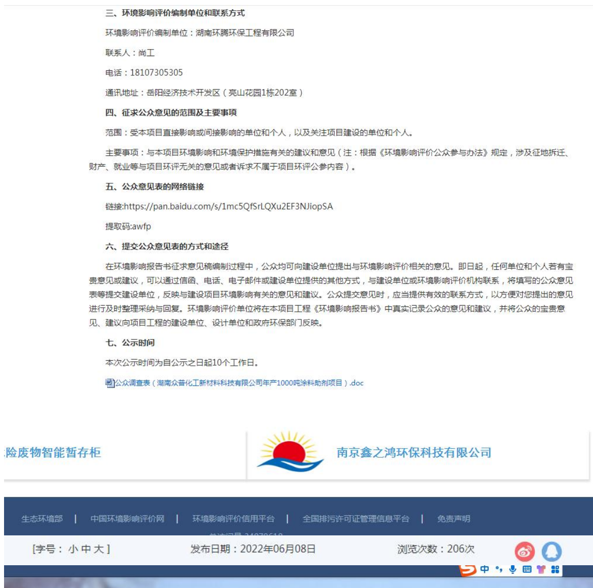
图 1 第一次环境影响评价网站公示截图照片