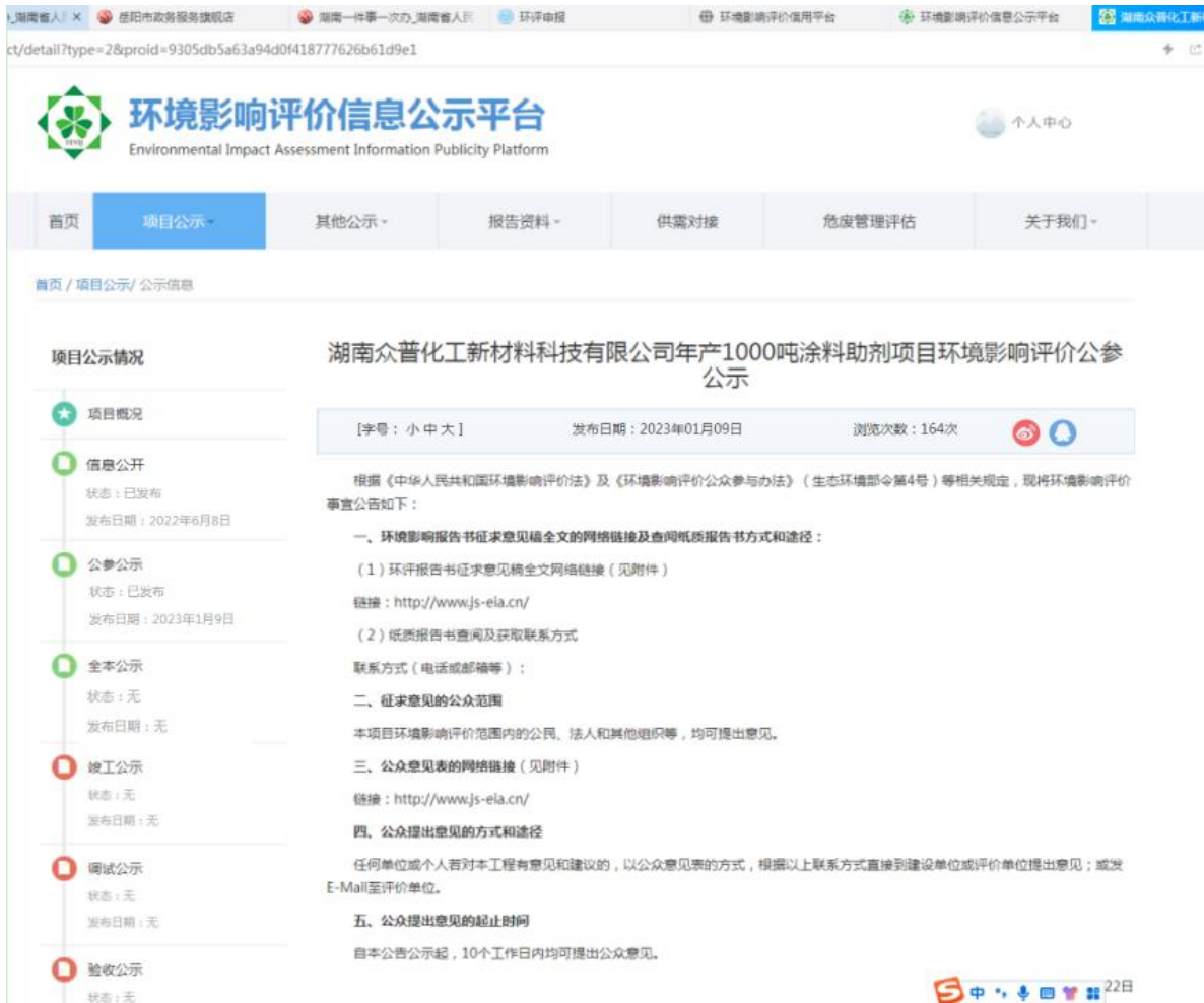
图 2 征求意见稿网上公示截图