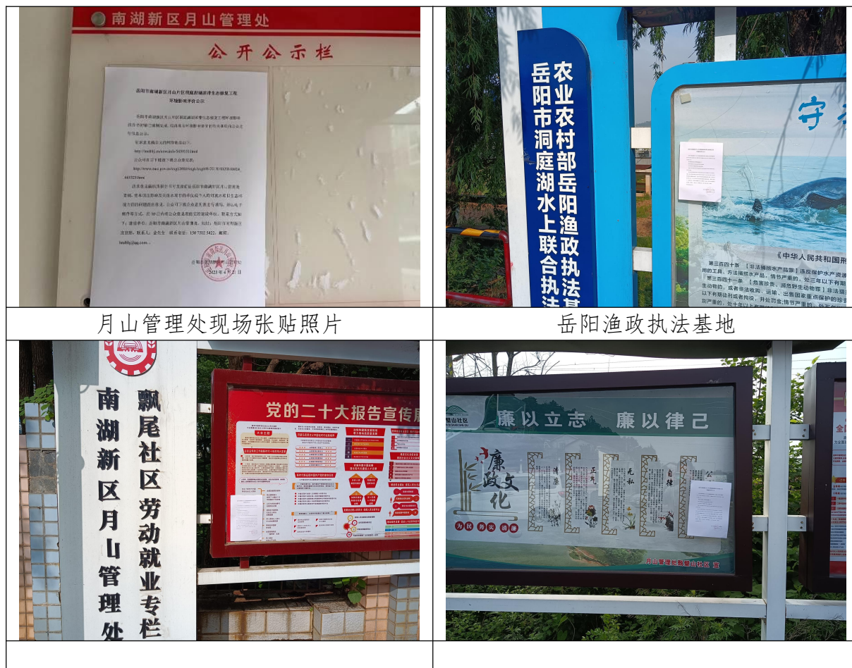
图 3.3-3 项目区公示粘贴照片

结合征求意见稿公示网上公示及登报纸公示，为方便项目区公众了解项目信息，项目在征求意见稿公示期间，同步在月山管理处、飘尾社区、甄碧山社区、岳阳渔政执法基地等地张贴了项目环评公示信息。