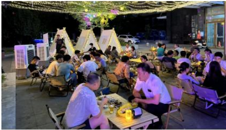
岳阳夜市市场火爆

本报讯(记者 罗凯)最近,山东淄博的烧烤火了。这个“五一”,你去吃烧烤了吗?其实,一直以来岳阳烧烤也是顶流般的存在,作为资深吃货的岳阳人自然无法阻挡它的魅力。除了去烧烤店“撸串”,岳阳人还会自带烧烤架,到野外享受烧烤带来的美味和乐趣。