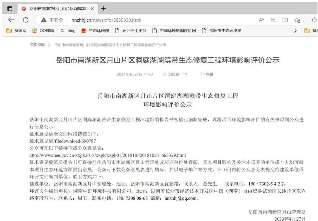
图 2.2-1 征求意见稿公示期间网络公示截图

项目于2023年4月27日在网站对项目征求意见稿及公众意见表的网络链接进行公示。公示链接为 http://hnzhj.cn/newsinfo/5859330.html ，公示截图如下：