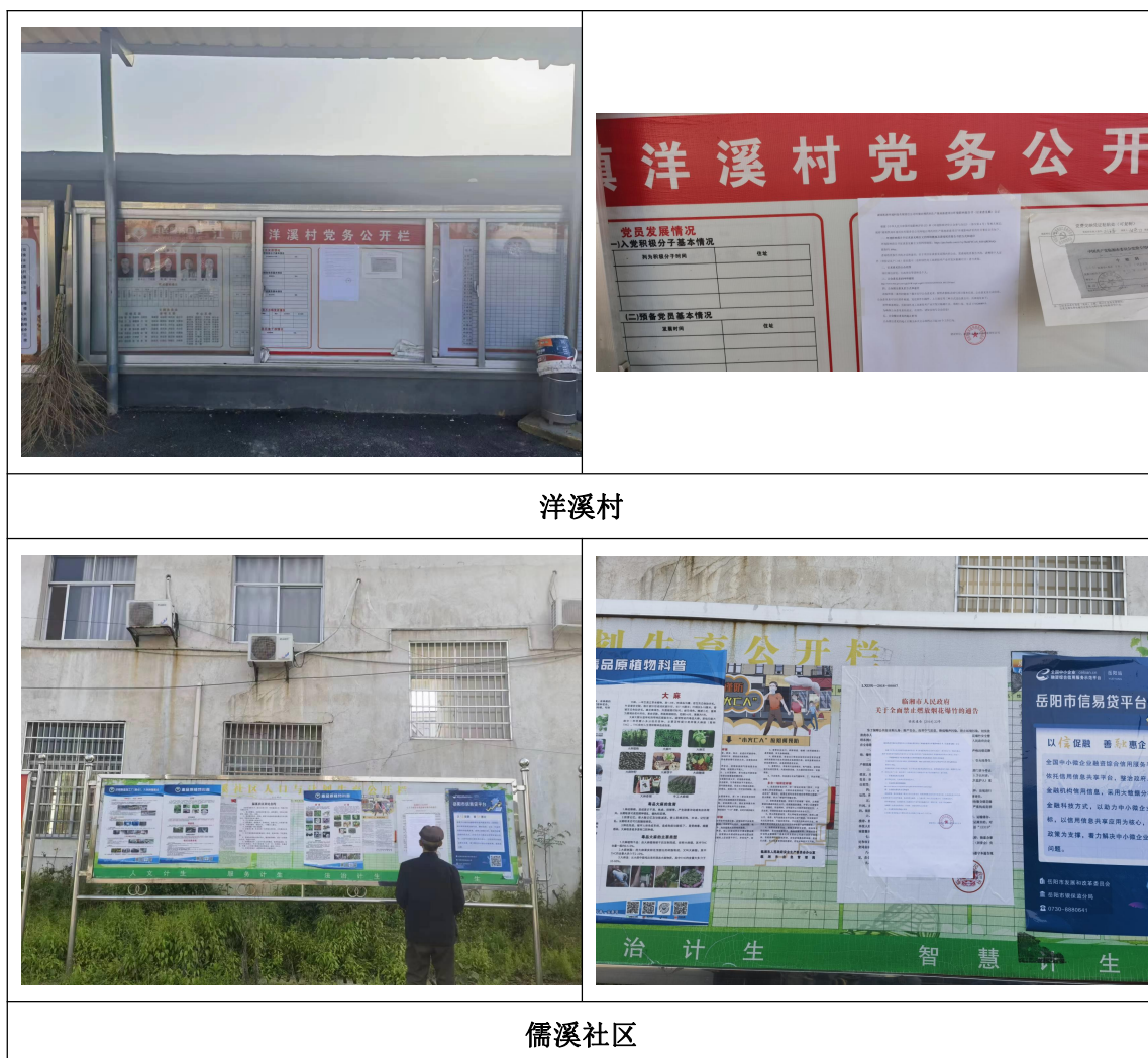
图 5 现场张贴公示照片