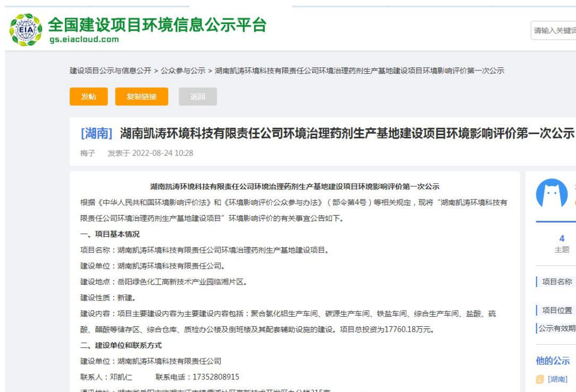
图 1 首次环境影响评价信息公开网站截图