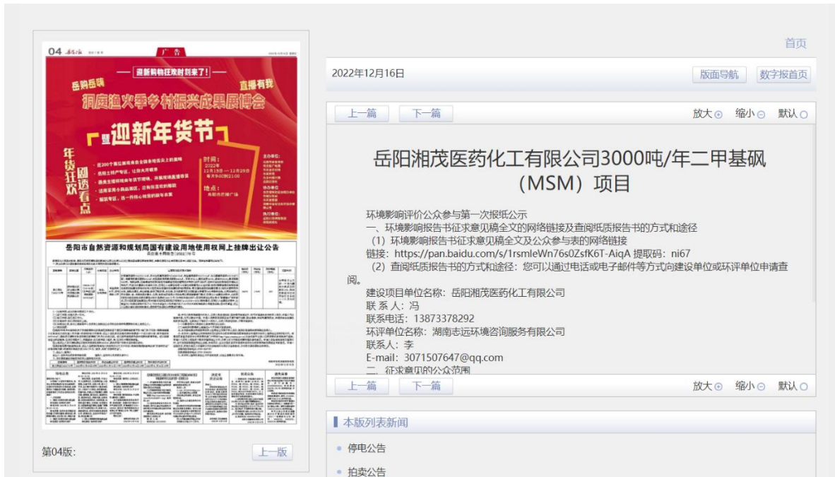
图 3-1 项目报纸上公示图片 (第一次)