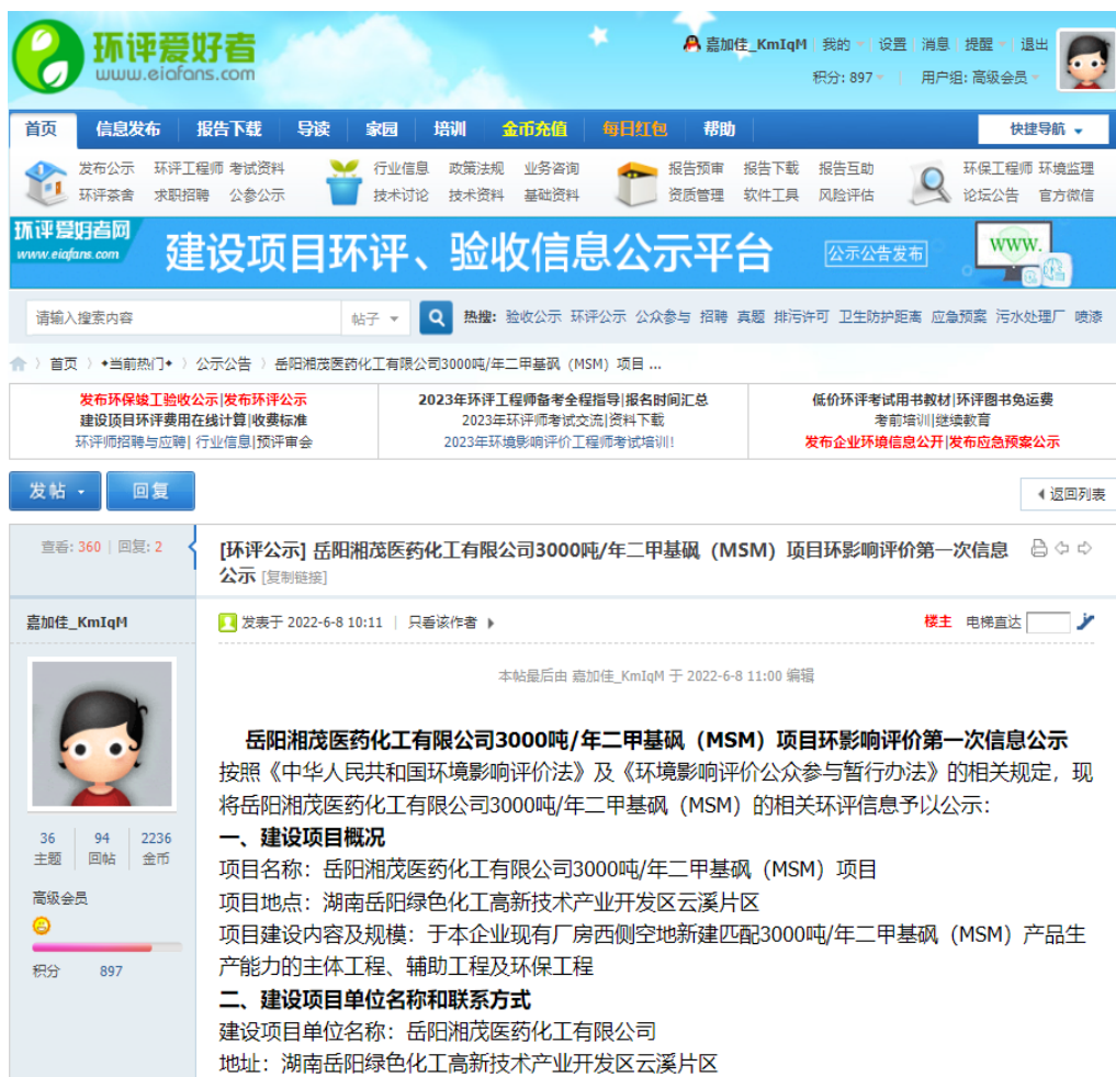
图 1 第一次环境影响评价网站公示截图