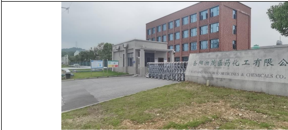
图 4 项目现场公示照片