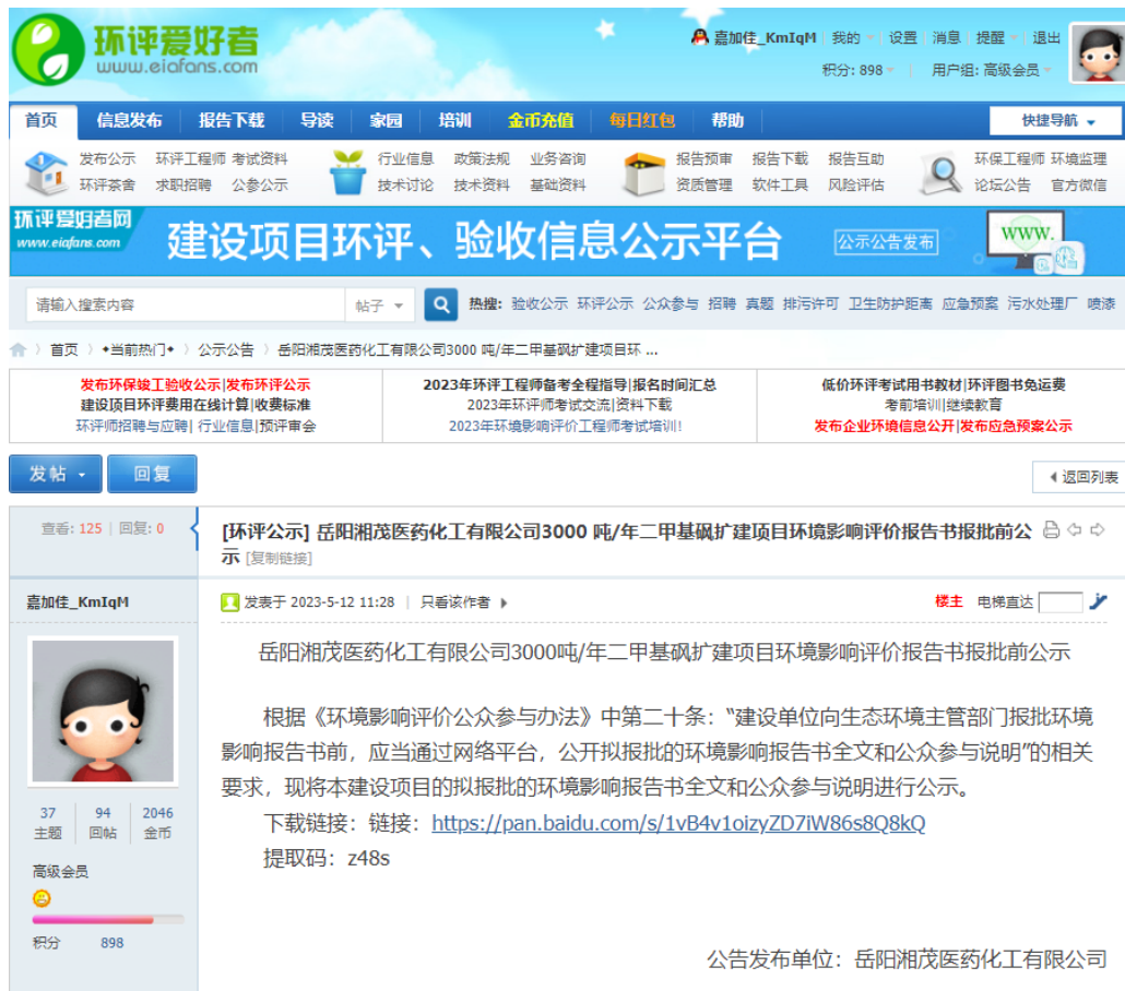
图 5 环境影响评价报批前公示网站截图