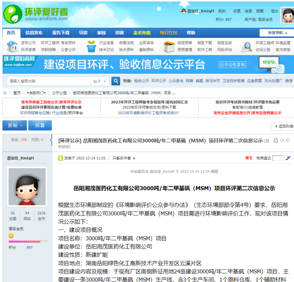
图 2 第二次环境影响评价网站公示截图