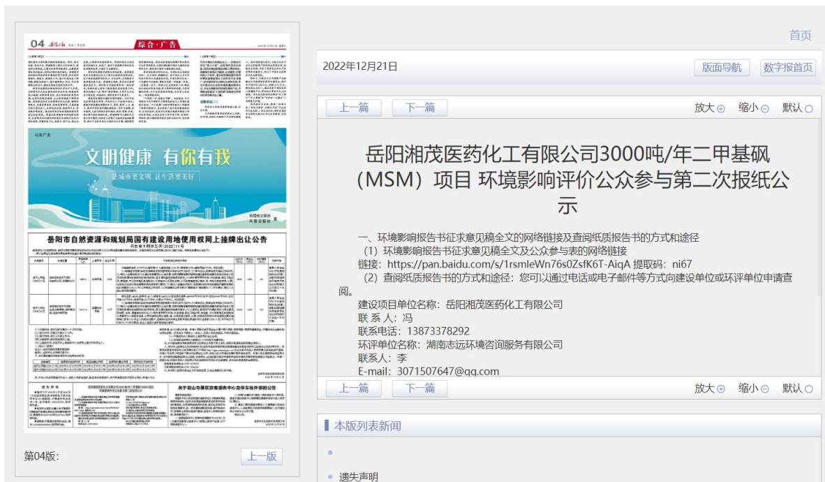
图 3-2 项目报纸上公示图片 (第二次)