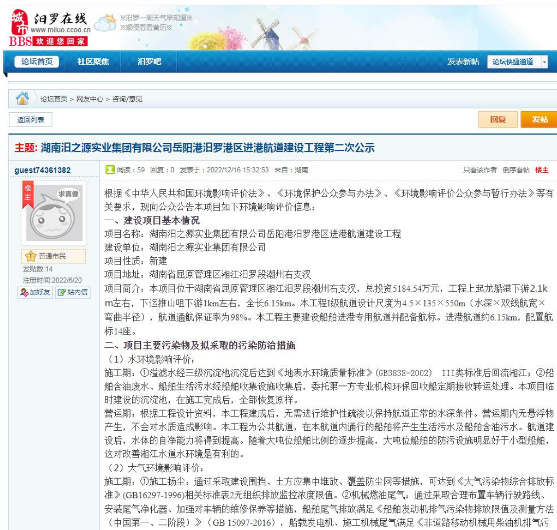
图2 征求意见稿网上公示截图