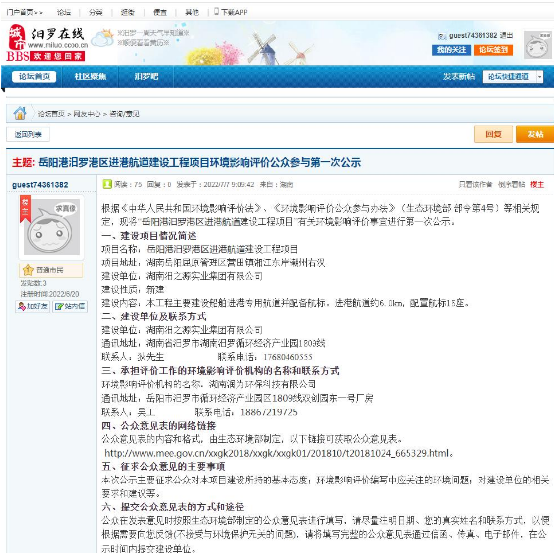
图 1 首次环境影响评价网站公示截图照片