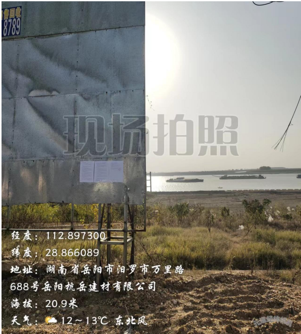
图4 项目现场公示照片