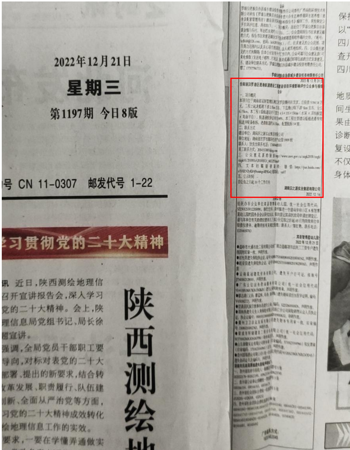
图3 项目报纸上公示图片