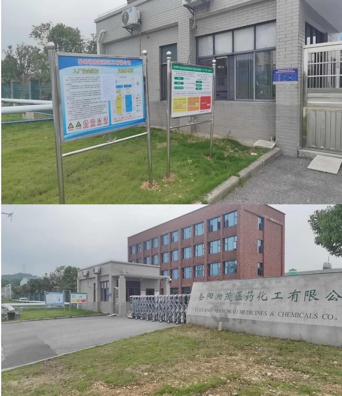
图4 项目现场公示照片

张贴区域选择拟建地附近、岳阳湘茂医药化工有限公司现有厂外公告栏上，张贴的时间为2022年12月14日至2022年12月27日，共计10个工作日。