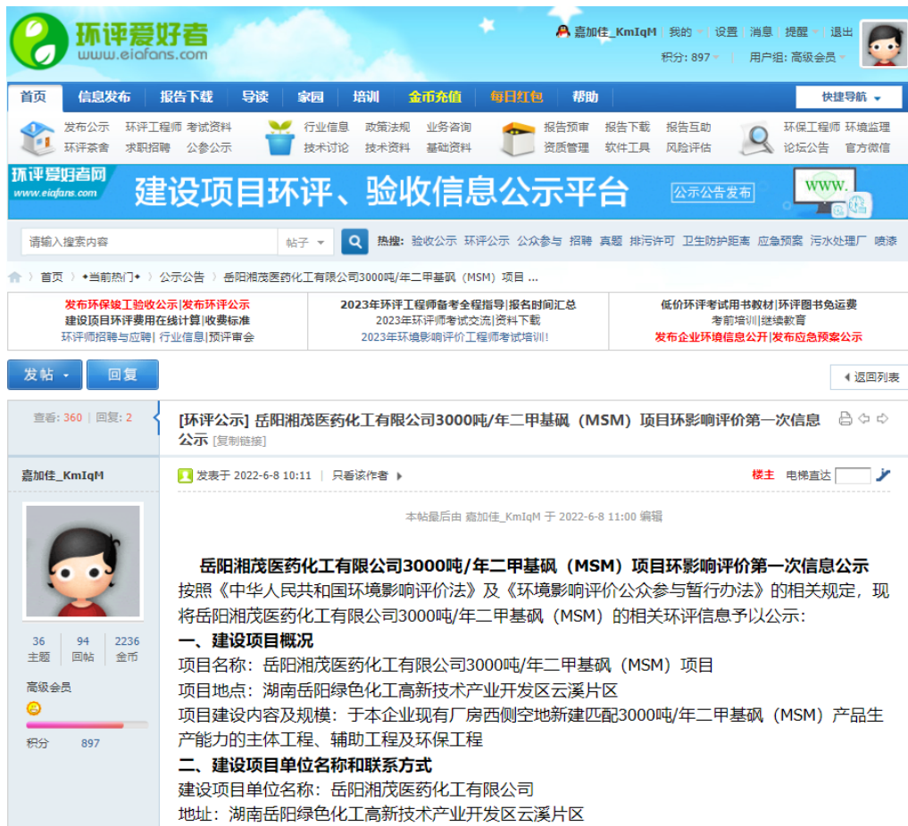
图 1 第一次环境影响评价网站公示截图