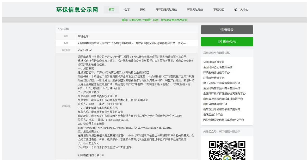
图1 首次环境影响评价网站公示截图照片