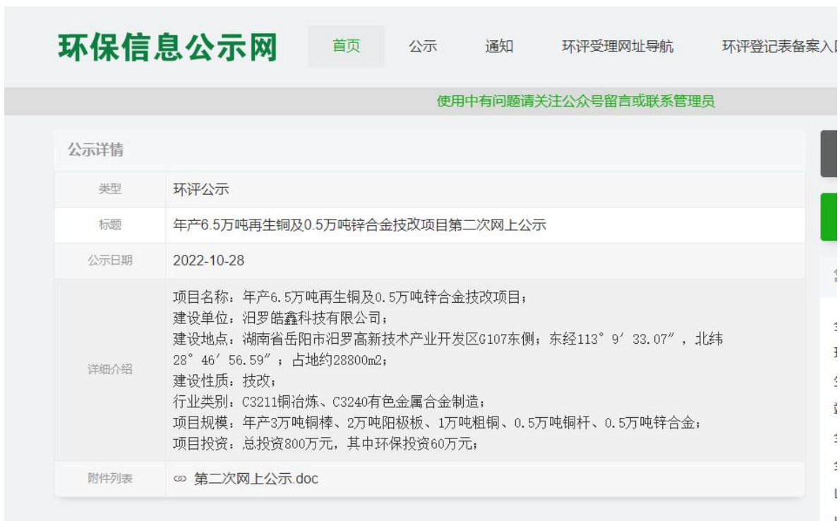
图 2 征求意见稿网上公示截图