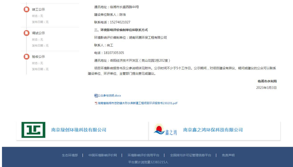
图 5 环境影响报告书报批前公示-网站公示截图