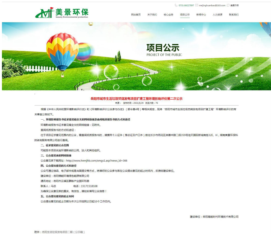
图 2 第二次网络公示截图