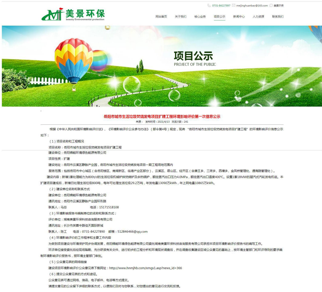
图 1 第一次网络公示截图