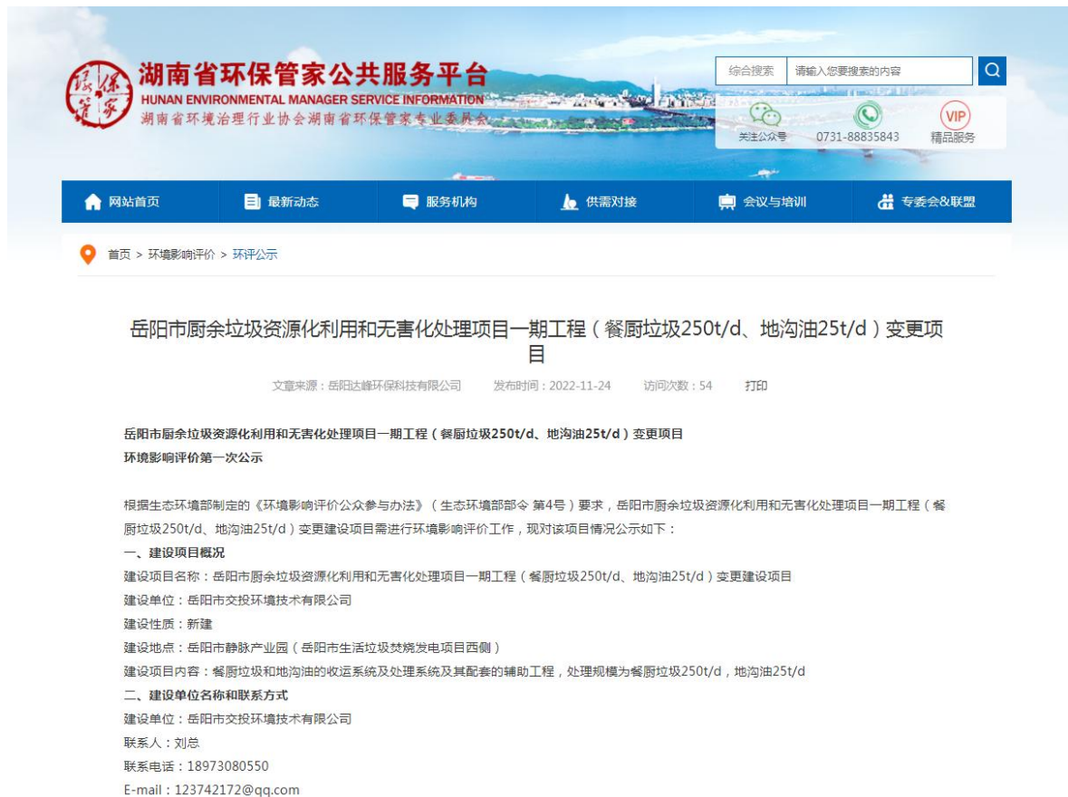
图 3-1 项目第一次网上公告