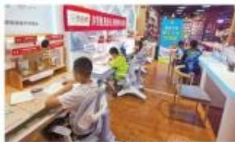
孩子们在托管班自主学习

暑假期间,孩子托管问题成为企业职工特别是双职工家庭的心头大患。日前,湖南省总工会、省妇联受联合下发《关于推进全省2023年湖南省爱心托管用人单位的通知》,鼓励支持用人单位为职工提供托育服务,重点建设好“单位门口”和“家门口”托管机构。