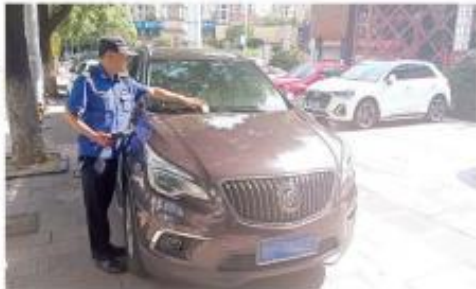
城管执法人员对停车场内违停车辆开具罚单并送达告知单