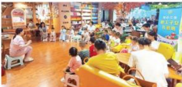
爱心文体中心的职工子女托管班