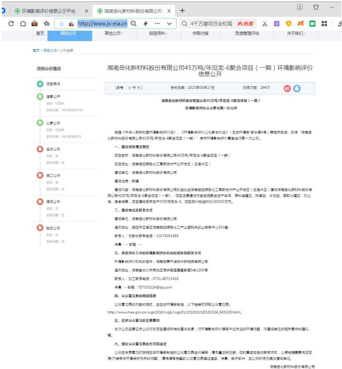
图 1 第一次网络公示截图

本次公示是按照管理办法的规定，在 7 个工作日内进行了第一次信息公开。故本次公示符合《环境影响评价公众参与办法》的要求。