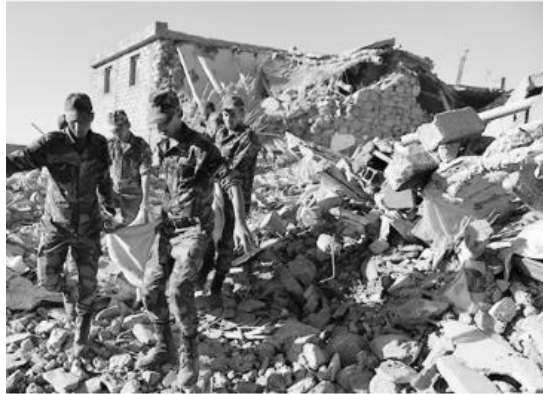
摩洛哥军人在受灾地区实施救援工作。

摩洛哥军人在受灾地区实施救援工作。摩洛哥红新月会提供 20 万美元紧急人道主义现汇援助。美联社 10 日称，土耳其、法国和德国均表示愿意向摩洛哥提供援助。邻国阿尔及利亚提出开放其领空，允许人道主义援助或医疗救助。