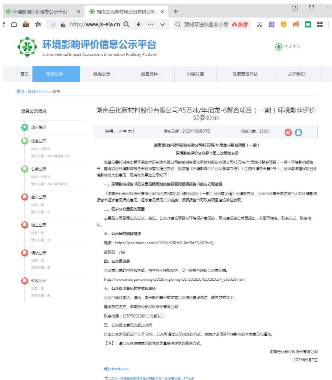
图 2 征求意见稿网络公示截图