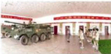
岳阳市岳州博物馆研学游

“除了课本，你还可以去‘游’。”随着暑假的来临，越来越多的家长开始为孩子规划暑假研学游行程。 这个暑假，不少家长带孩子走出家门，参观博物馆、科技馆、大学等场所，让孩子在实践中学习，增长见识，开阔视野。研学游已成为家庭教育的新选择。 在岳阳，不少家长带孩子走出家门，参观博物馆、科技馆、大学等场所，让孩子在实践中学习，增长见识，开阔视野。研学游已成为家庭教育的新选择。