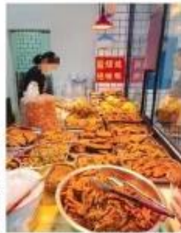
“生鲜灯”亮下的熟食诱人

一位以卖水果经营为主的店主告诉记者,她开店十几年,一直使用的普通照明灯,以不使用“生鲜灯”,她知道“生鲜灯”的“打光美颜”效果好,但是自己卖的是熟客生意,不会刻意追求水果卖相,对于品相较差或者不太新鲜的的水果,她会作特价处理,对于“生鲜灯”照得发亮的情况,她认为这对于消费者是坏事,对于他们这些经营者来说,也会起到一种自律作用,诚信经营,赢得顾客。