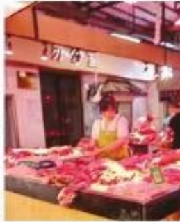
“生鲜灯”亮下的鲜肉