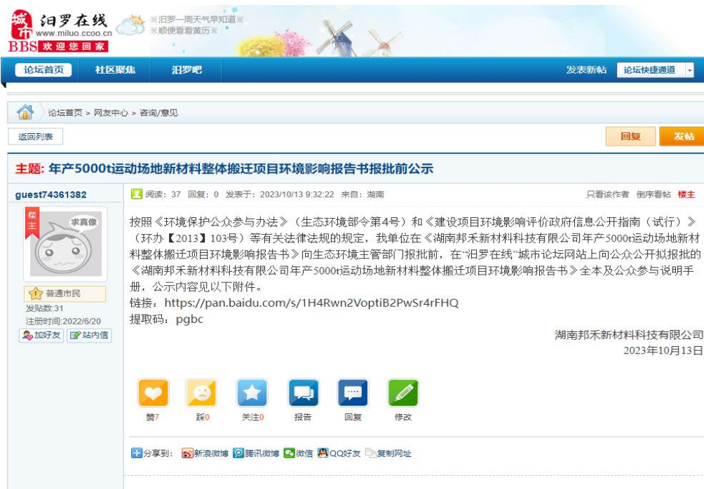
图 6 报批前公示

建设单位在环境影响报告书报批前，于 2023 年 10 月 13 日在“汨罗在线”城市论坛网站上进行了报批前公示，公开了项目环评报告书及公参说明手册。