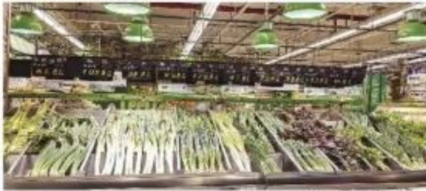
“生鲜灯”亮下的蔬菜新鲜欲滴

重庆菜市场的消费者,可能会经常遇到这样一个现象,几乎每个摊位都使用了各种颜色的“生鲜灯”,在灯光的照射下,猪肉、蔬菜等显得特别新鲜,但买回家后发现,它们仿佛“变了味”——肉类颜色发灰,蔬菜干瘪无光。