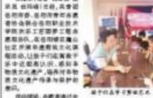
汨罗市五里小学开展剪纸活动

剪纸是中国民间艺术之一，历史悠久，源远流长。为了让孩子们了解传统文化，感受剪纸艺术的魅力，汨罗市五里小学开展了剪纸进社区活动。 活动中，邀请了民间艺人担任指导老师，手把手教孩子们剪纸。孩子们兴趣浓厚，剪出了各种各样的图案，感受到了传统文化的魅力。