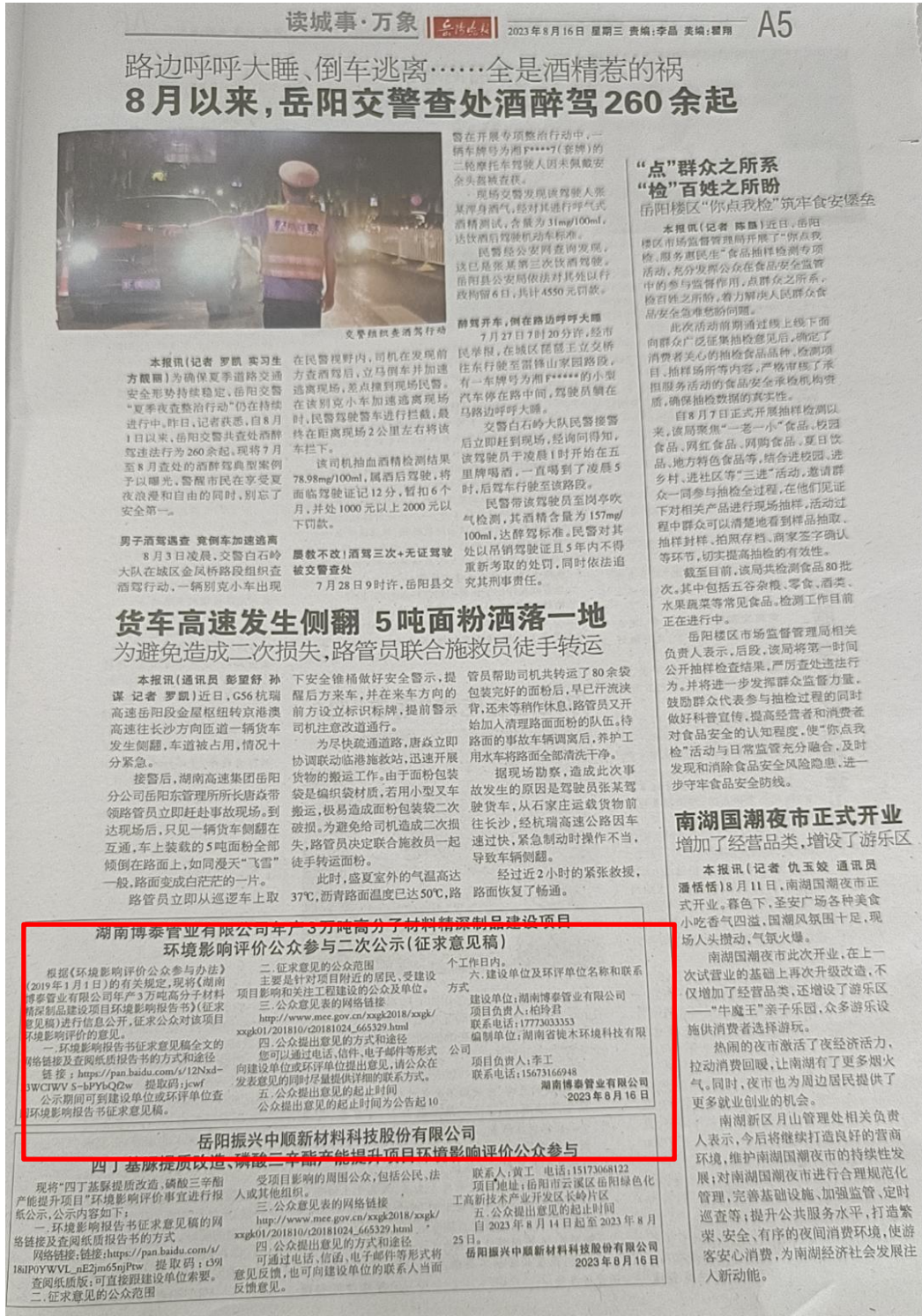
图 3 第一次报纸公示照片

公众易于接触的报纸公开，且在征求意见的 10 个工作日内刊登征求意见稿公示信息 2 次，载体选取符合《环境影响评价公众参与办法》第十一条“通过建设项目所在地公众易于接触的报纸公开，且在征求意见的 10 个工作日内公开信息不得少于 2 次”的要求。