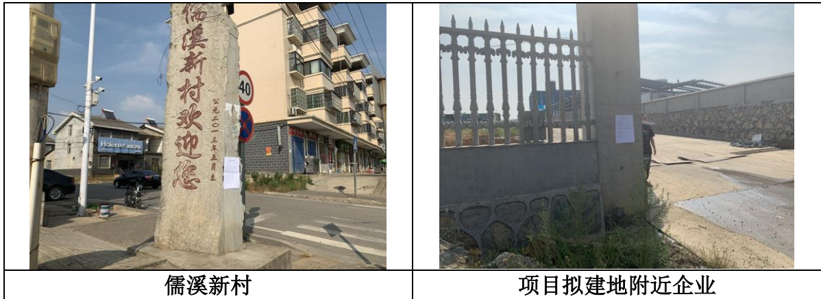
图 4 第二次环境影响评价信息公示照片（现场张贴）

我公司在项目环境影响报告书征求意见稿形成后，采取了网络信息公示、报纸公示以及现场张贴公示 3 种形式向评价范围内公众进行了环境影响信息公示，公示日期均不少于 10 个工作日，并发布了征求意见稿全文查看的网络链接、查阅纸质报告书、公众意见表的网络链接获取方式和途径。